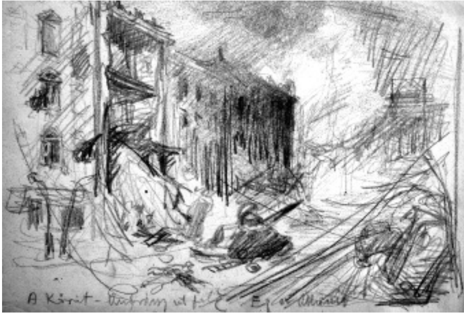
A Körút Andrassy út felé