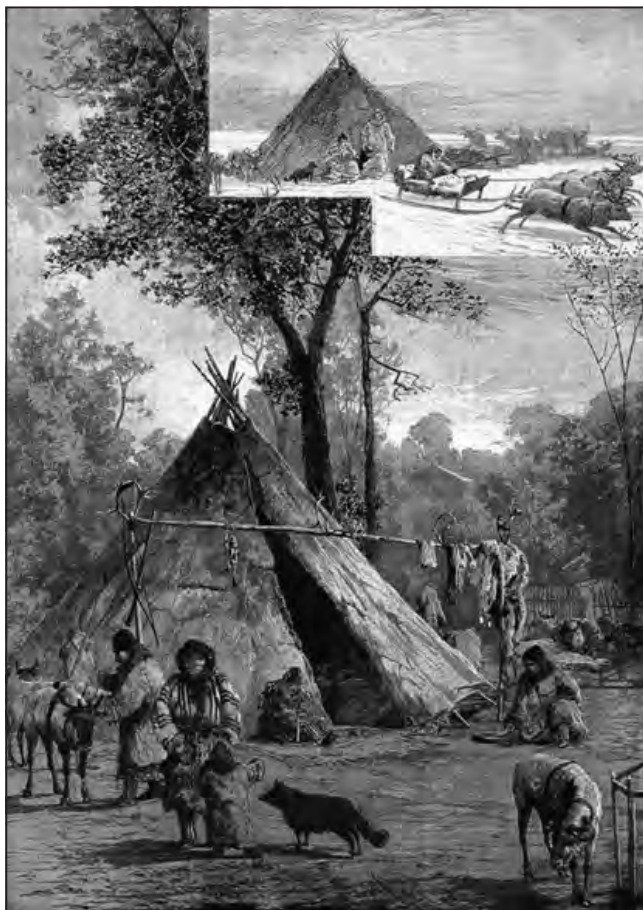
Szamojéd falu az Állatkertben, 1882, Vasárnapi Ujság