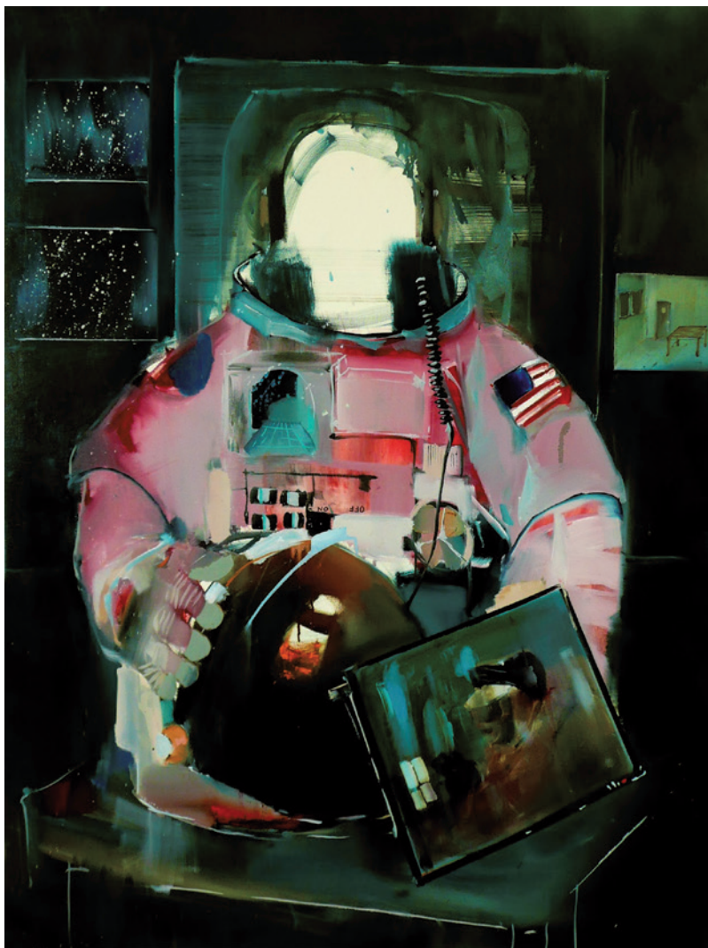
DEBRECZENI IMRE Hibrid narratíva