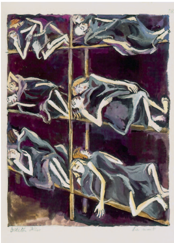
BÁN-KISS EDIT Éjszaka / La nuit j. n. / s. s., 1945 gouache, papír, 320 × 250 mm Dr. Helmuth Bauer gyűjteménye

☛ A tragikus kor rányomta a bélyegét a művekre és azok sorsára is. Igaz, hogy valóságos kaland volt most egy-egy műre rátalálni?