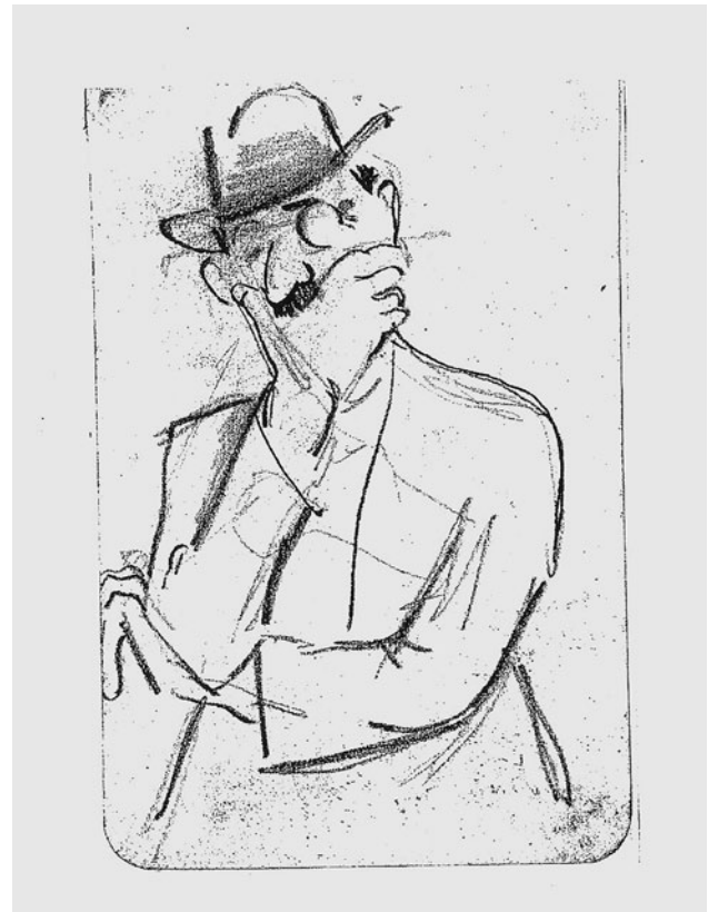
WITTMANN ZSIGMOND Modell, akrobata, festő és a kelet-európai emigránsokat figyelő titkosrendőr; rajzok a vázlatfüzetből