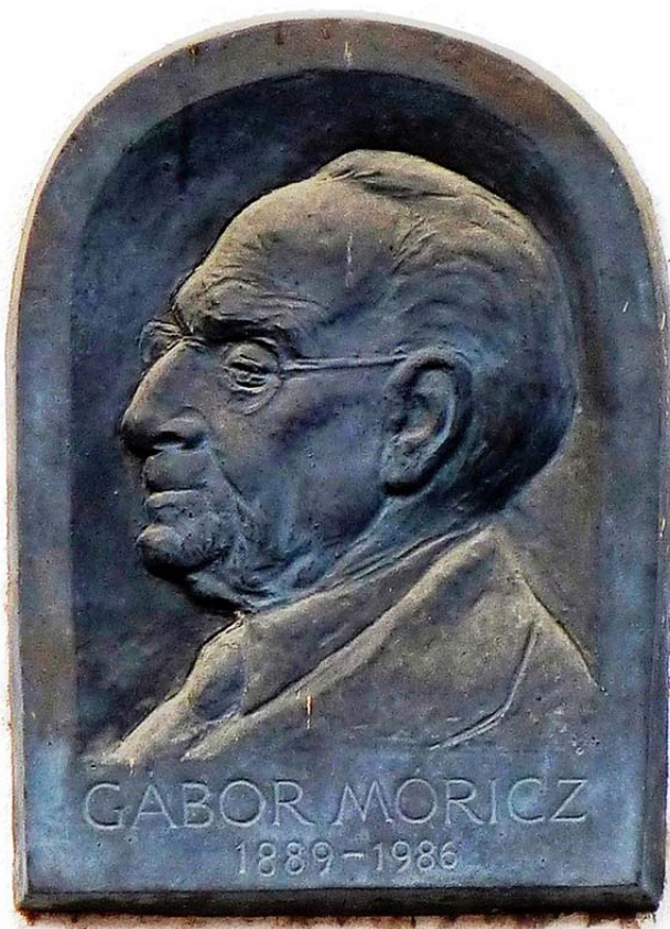
Gábor Móric-emléktábla, Budapest VIII., Százados út 4.

Szabó Iván (Budapest, 1913. július 1. – Budapest, 1998. február 11.) szobrászművész. Gábor Móric festőművész fia. 1933–1934 között a Közgazdasági Egyetemen, majd 1934–1939 között a Magyar Képzőművészeti Főiskolán tanult. Tanárai Kerényi Jenő (1908–1975), Bory Jenő (1879–1959), Tarr István (1910–1971) voltak. Mestere pedig Medgyessy Ferenc (1881–1958) volt, akinek a műtermében dolgozott. 1939-től lakott a budapesti Százados úti Művésztelepen. 1934-től a Szocialista Képzőművészek Csoportjának, 1942-től a Képzőművészek Új Társasága (KÚT) tagja. Aktívan táncolt, külföldre járt az 1930-as évektől. A Muharay, majd 1948-tól a Honvéd Népi Együttes vezetője, koreográfusa volt. 1949 és 1952 között a Magyar Képzőművészek és Iparművészek Szövetsége (MKISZ) főtitkára, majd elnökségi