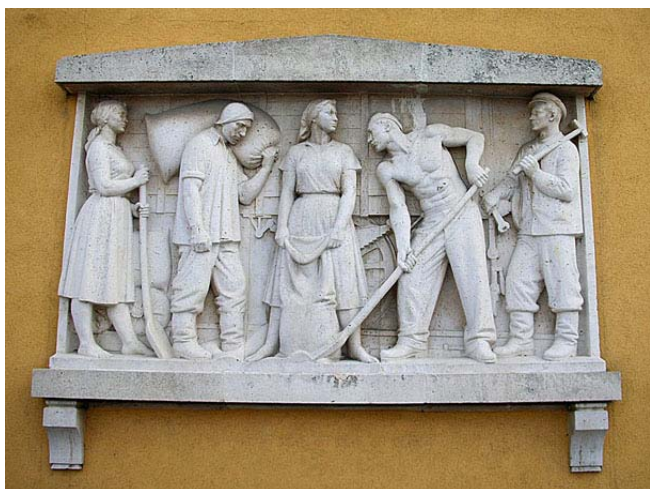
Martsa István: Dombormű a székesfehérvári vasútállomáson

Az 1960-as évektől vett részt hivatalosan kiírt állami érem pályázatokon. Az ezekre készített alkotásai közül több „hivatalos állami érem” került gyártásra, mint például a Bábolnai Állami Gazdaság számára készített lovas érme, vagy Dömös város érme (1963), vagy a Miskolci Filmfesztivál érmei (1966) stb. Érmei bekerültek a Szentendrei Éremantológiába is, amely munkákat, mint a magyar éremművészet kimagasló alkotásait, kiállításokon mutattak be szerte Európában.