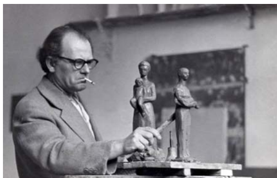
Martsa István mintáz

1968, 1969, 1970 – Nívódíj a köztéri szobraiért 1970 – Magyar Népköztársaság Érdemes Művésze 1972 – Munka Érdemrend arany fokozata; Szocialista Munkáért Érdemérem