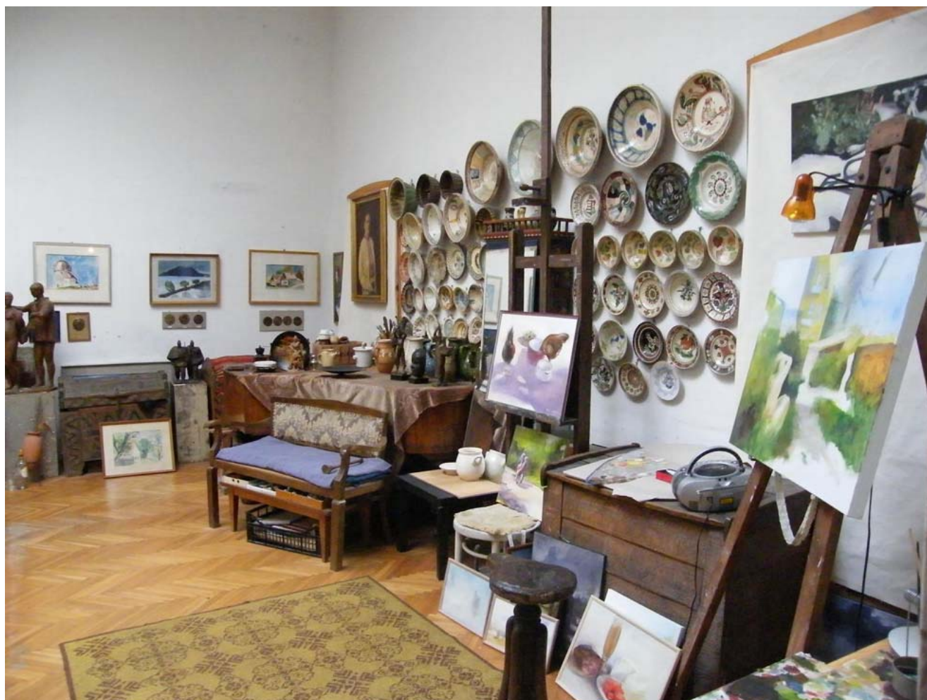
M. Szűcs Ilona műterme

2005 – Városvédő Egyesület, Podmaniczky Terem, Budapest