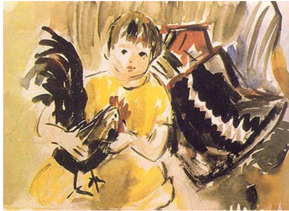
M. Szűcs Ilona: Piroska kakással, akvarell

Martsa Piroska (Budapest, 1963. június 5.) szobrászrestaurátor művész, animációs mozdu-