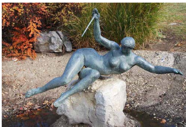
Martsa István Tisza című szobra Szolnokon

(Salgótarján, Ipari Szakmunkásképző Intézet); Felszabadulási emlékmű , 1965, bronz (Hajdúböszörmény); Tisza – Fekvő nő , 1966–1969, bronz (Szolnok, Damjanich János Múzeum); Kürtös lány – Zenélő kislány , 1967, bronz (Siklós, gimnázium); Braun Éva , 1968, bronzportré (Budapest, I. ker. Szilágyi Erzsébet Gimnázium); Napernyős nő – Napozó nő , 1968, hazshti mészkő (Balatonalmádi, Pannónia étterem); Ülő nő , 1968, mészkő (Budapest, VIII. ker. József utca); Ülő paraszt férfi – Bíró , 1969, mészkő (Budapest, XVII. ker., Pesti út 165.); Kubikos , 1970, bronz (Kalocsa, Ecetgyári híd); Talpasok , 1975, bronz (Vaja, Művelődési Ház parkja); Vak Bottyán – Bottyán János , 1977, bronz lovas szobor (Esztergom, Széchenyi tér [2006 májusa óta a városháza udvarán]); Bókay János , 1978–1979, bronz portré (Budapest, VIII. ker., Bókay János Egészségügyi Szakközépiskola, Csobánc utca 1.); Nagy Balogh János , 1975,