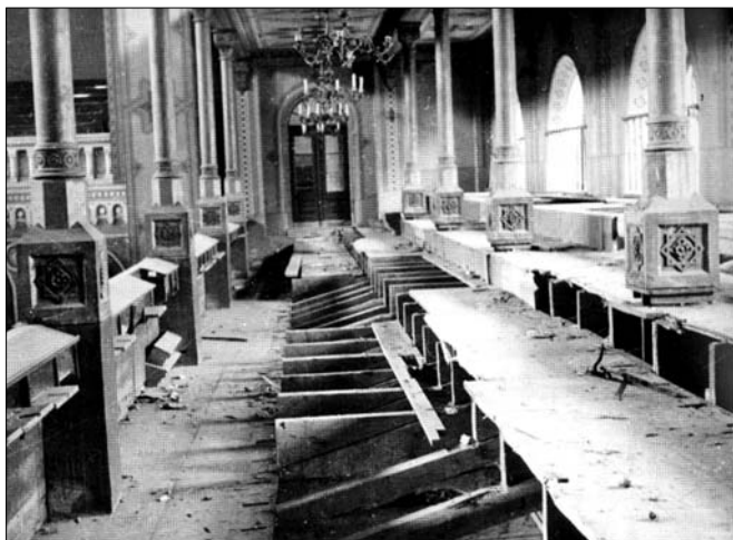
A kecskeméti neológ zsinagóga 1945-ben