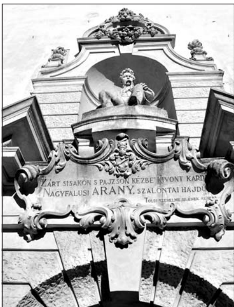
Arany János a nagyszalontai Csonkatorony bejárata fölött