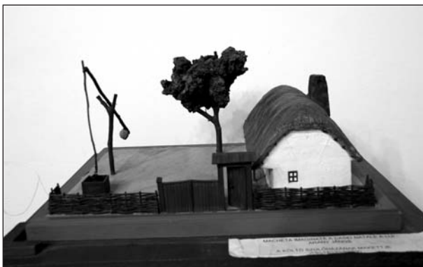
Arany János szülőházának kicsinyített mása a nagyszalontai Arany János Emlékmúzeumban

Kezdő irodalomtörténészként azon töprengtem el, ki és mikor figyelt fel Arany János másságára, a többségtől eltérő kiválóságára. A válasz egyszerű és vitathatatlan. Alig érte el a hatodik évét, amikor a templom női szakaszát, édesanyját odahagyva felszökött a karzatra, és az iskolások közé merészkedett. Az éneklést irányító preceptor arra figyelt fel, hogy egy ismeretlen kisgyerek a zsoltárból kikeresi a sorra kerülő éneket, és bátran fújja a többiekkel. Az istentisztelet végeztével bevitte az iskola rektorához, és megkérdezték: ki ő és miként tud iskolába járás híján olvasni? Ekkor elmondta, hogy még nem iskolás, de édesapjától megtanult írni és olvasni. Utóbbi be is bizonyította: olvasott, bibliai történeteket idézett, sőt a Pater noster t, s a Credot zengő latin nyelven mondta el. A rektornak sem kellett több! Beírta a tanulók közé, sőt, keze alá adott 20–30 nehézfejjű nebulót az alig 6 éves fiúcskának.