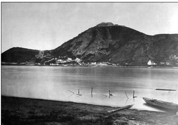
Visegrád villanegyede az 1870-es években a Görgey–Latinovits villával (A Magyar Nemzeti Múzeum Mátyás Király Múzeuma, Visegrád)

Visegrád, az egykori király székhely, a XVIII. századi koronauradalmi mezőváros újralfedezése a reformkorban történt meg, amikor a szépirodalomban, képzőművészetben mint a dicső múlt jelképe jelenik meg. 4 A hajó-, majd a vasútközlekedés kiépülésével a XIX. század utolsó harmadától a budapestiek által kedvelt üdülőhellyé vált. A történelmi festészetből ismert műemlékeinek helyreállítása Viktorin József helyi plébános kezdeményezésére kormányzati támogatással 1872-től indult meg. A magyar műemlékvédelem értékmentő tevékenységének egyik legkorábbi színhelye Visegrád, ahol a korszak két kiváló szakembere, Schulek Frigyes építész és Henszlmann Imre művészettörténész irányításával kezdődtek meg a helyreállítási munkálatok a fellegvárban és a Görgey–Latinovits-villa szomszédságában magasodó XIII. századi lakótoronynál (Salamon-torony), mint erről a korabeli fénykép is tanúskodik. 5