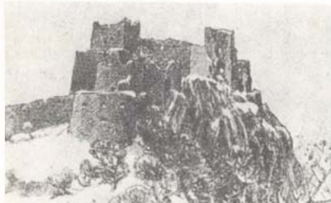
Detrekő várának romjai