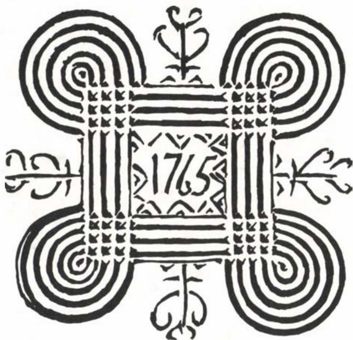
Finn sajtynyomó véselt diszítése