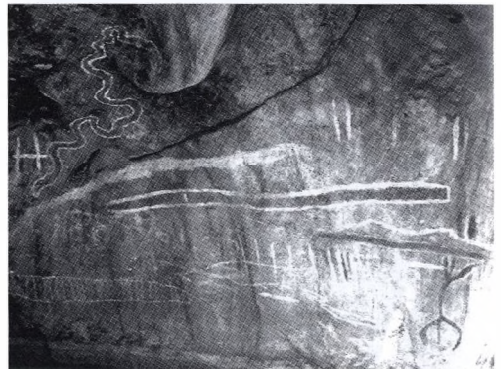
Őslakosok sziklafestményei az Archway bejáratánál