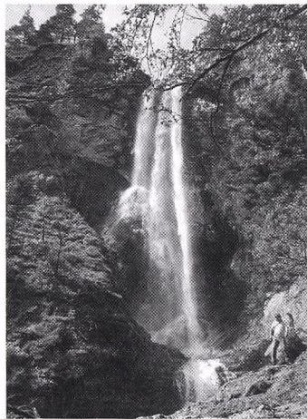
Az Ötschergraben egyik vizesése

Szerdán az Ötscher-cseppkőbarlang szerepelt a program első részében, mivel az egyébként is csak hétféteken nyitva tartó barlangot a nyári szezonban még szerdai napon lehet előzetes bejelentés nélkül felkeresni. Az időjárással továbbra sem voltunk jó barátságban, szakadó esőben autóztunk a barlang parkolójáig, onnan azonban már csak szemerkélő esőben baktattunk fel a barlang bejáratánál lévő kis faházikóig. Mikor odaértünk, egy csoport