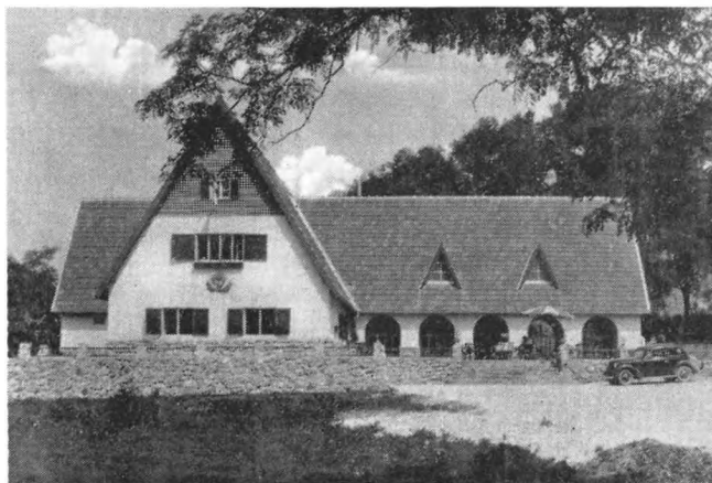
Az aggteleki Barlang-szálló a felavatás idején