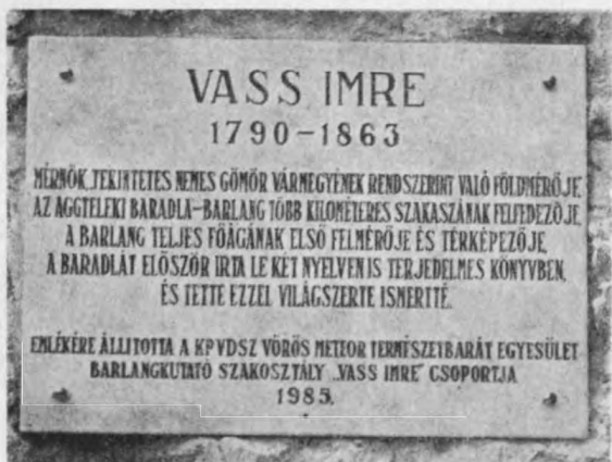
A vándorgyűlésen felavatott emléktábla