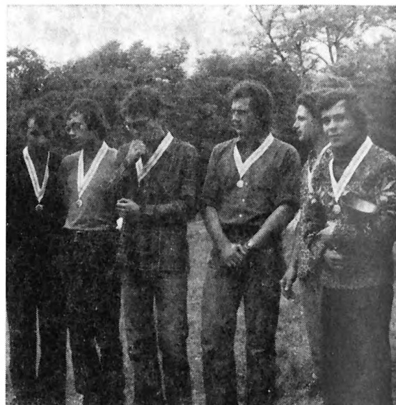
A barlangverseny első két helyezett csapata

Este a község régi sportpályáján felvert sátor-tábor területén hangulatos tábortűz mellett gyűltek össze az ország minden részéből érkezett kutatók. Innen indult és hajnalban ide érkezett vissza az ügyességi versenyben résztvett 12 csapat. A 3 fős csapatoknak terepen és barlangban való tájékozódásból, kötél- és ereszkedésből és mászásból, valamint elméleti kérdésekből kellett vizsgáznunk. Végeredményben az első helyezettnek járó Marcel Loubens vándorkupát a VMTE Tektonik Bgkut. Csoport nyerte el az Óbudai Kinizsi S. K. Bgkut. Csoport és a Miskolci NME TDK Bgkut. Csoport előtt.