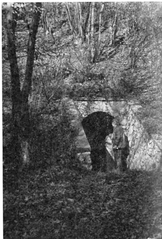
A Vass Imre-barlang új bejárata