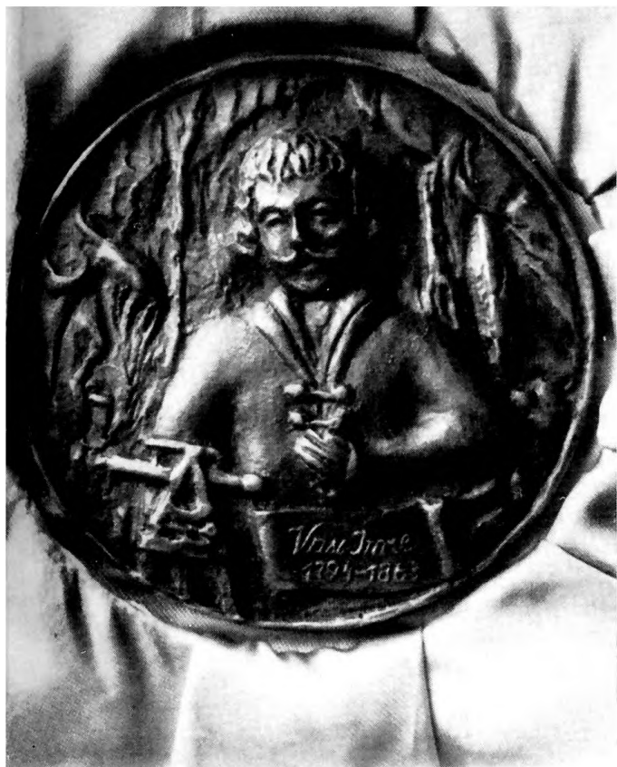
Vass Imre (1794 – 1863)