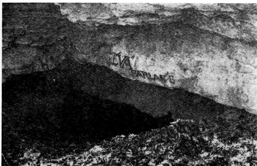
2. ábra. A „Sűrűhegyi” Ördöglik bejárata az „Éva-barlang” felirattal 1934. júl. 21-én.

1950-ben Báthy Ödön topográfus közreműködésével 1:5000-es léptékű szintvonalas földtani térképet készítettem az Ördögárokról (31.), bejelölve rajta néhány barlang helyét is, melyeknek a tszf.-i magasságát is bemérettem tahiméteres módszerrel. Az Ördöglik tszf.-i magassága ekkor 370,1 m-nek adódott, ami csak kevéssel helyesbíti az általam 1941-ben aneroiddal mért 369m-es adatot.