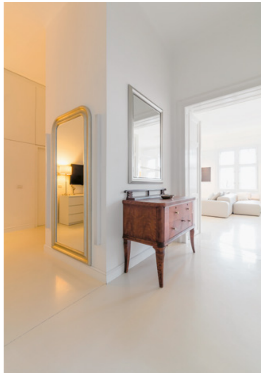
▼ Hangsúlyos ebben a lakásban a fénytervezés, a világítótestek kiválasztása