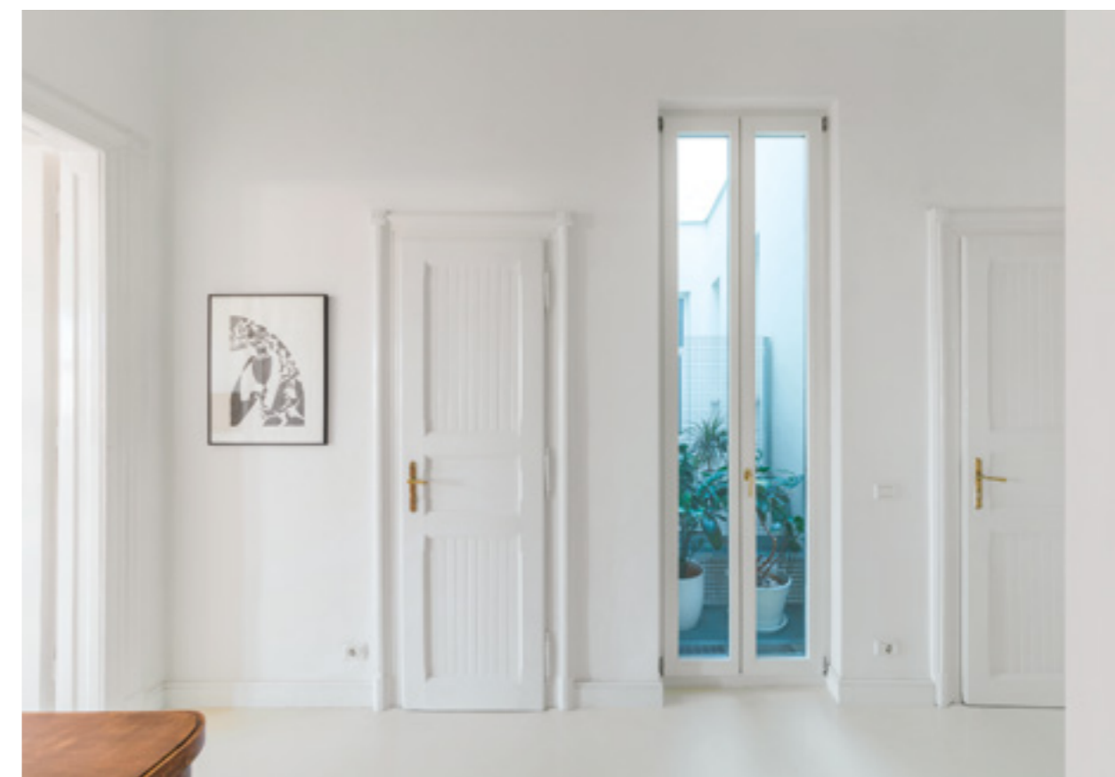
▲ Új szerepben a lichterof