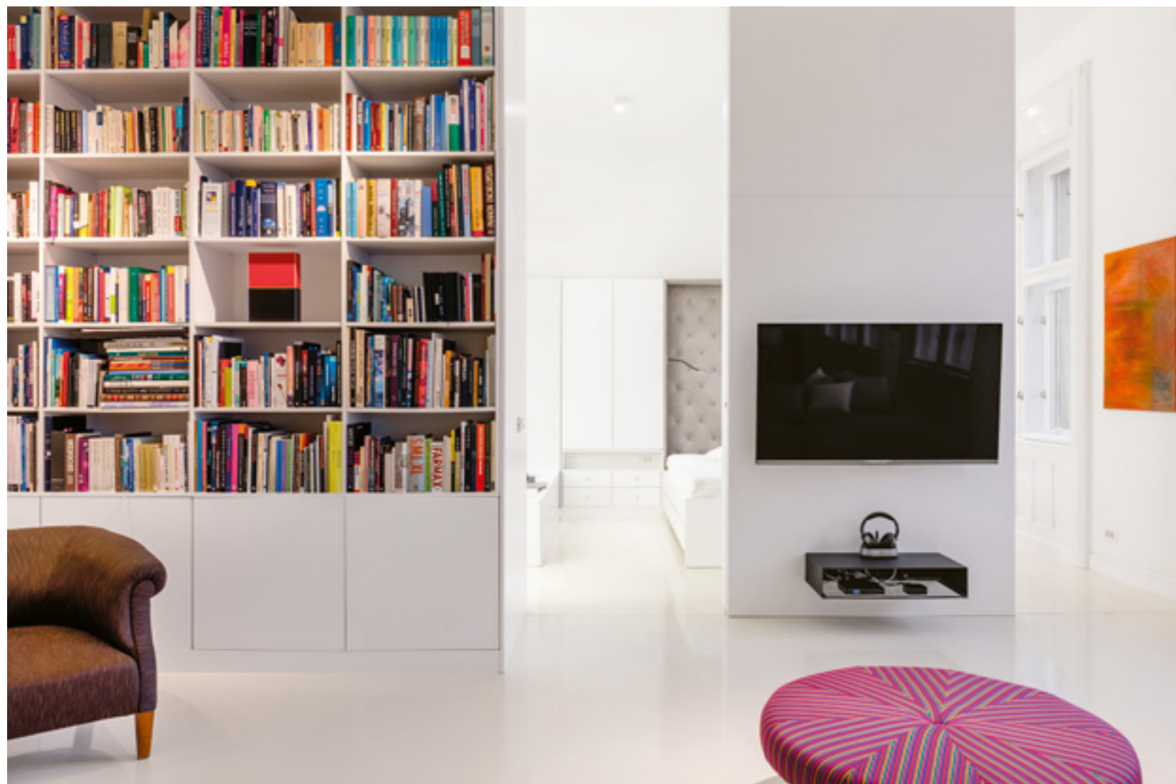
▲ Könyvespolc és médiafal határolja el a nappali részt a fürdő-háló terétől

dő fiatalok építészetről (OCTOGON 2004/2).