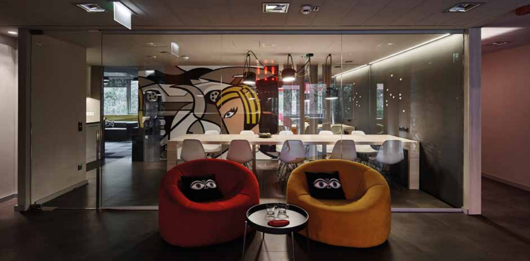
A munkavégzés itt cseppet sem kötött

a kép a bejáratnál teljes egészében látható, a belső terekben pedig egy-egy fekete-fehér részlet, amelyekből csak egy részt emeltek ki színessel. Ám nem ez az egyetlen finomság: a tartópilléreket – az alapvetően téglalap alakú iroda egyedüli meghatározóit – tükörrel borították. „Ez egy optikai trükk, a tükör mindig nagyon jó, ha a térben le akarunk simítani dolgokat” – jegyezte meg