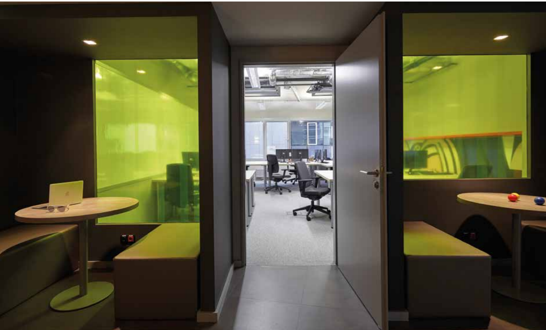
A társalgó-boksztokat az ügyfelek is hamar megkedvelték

elhagyásával is, elvégre az irodának kertesített tetőterasa is van. Minden sarokból sugárzik, hogy a W.UP „friss cég, de nem bizonytalan, hanem nagyon is határozott – jelenti ki Dékány. – Az egész tervezés másfél hónap alatt lezajlott. A megrendelő nagyon következetes volt, nagyon tudta, mit szeretne, ráadásul hosszú távon gondolkodik.”