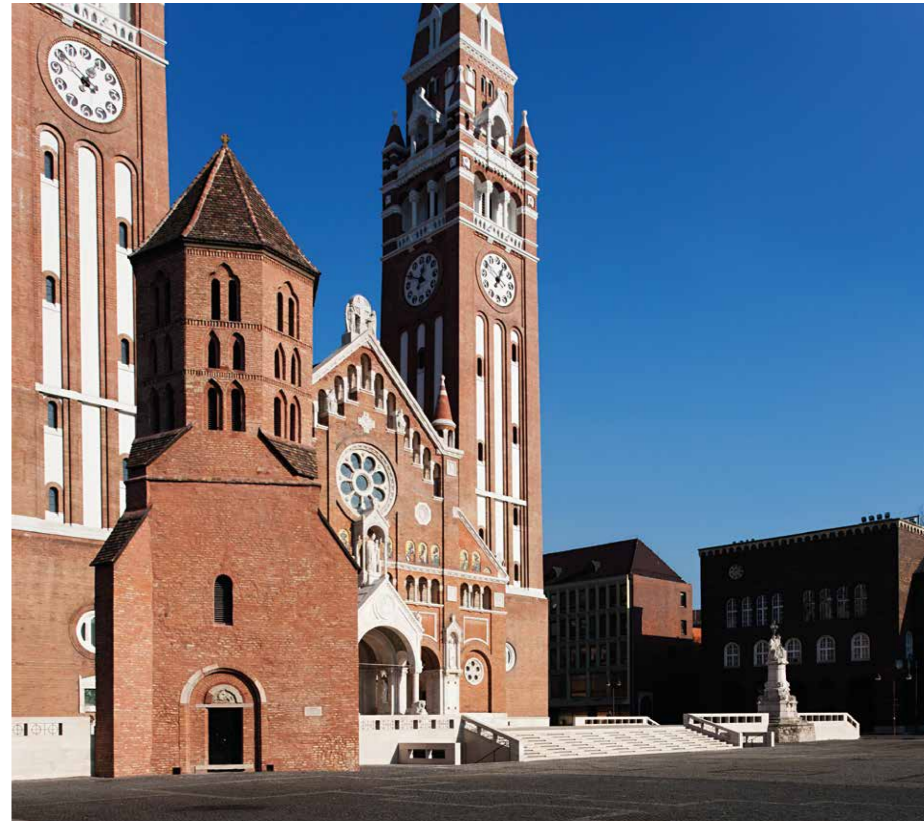
.....a Dómot megnyitottuk a tér felé!”