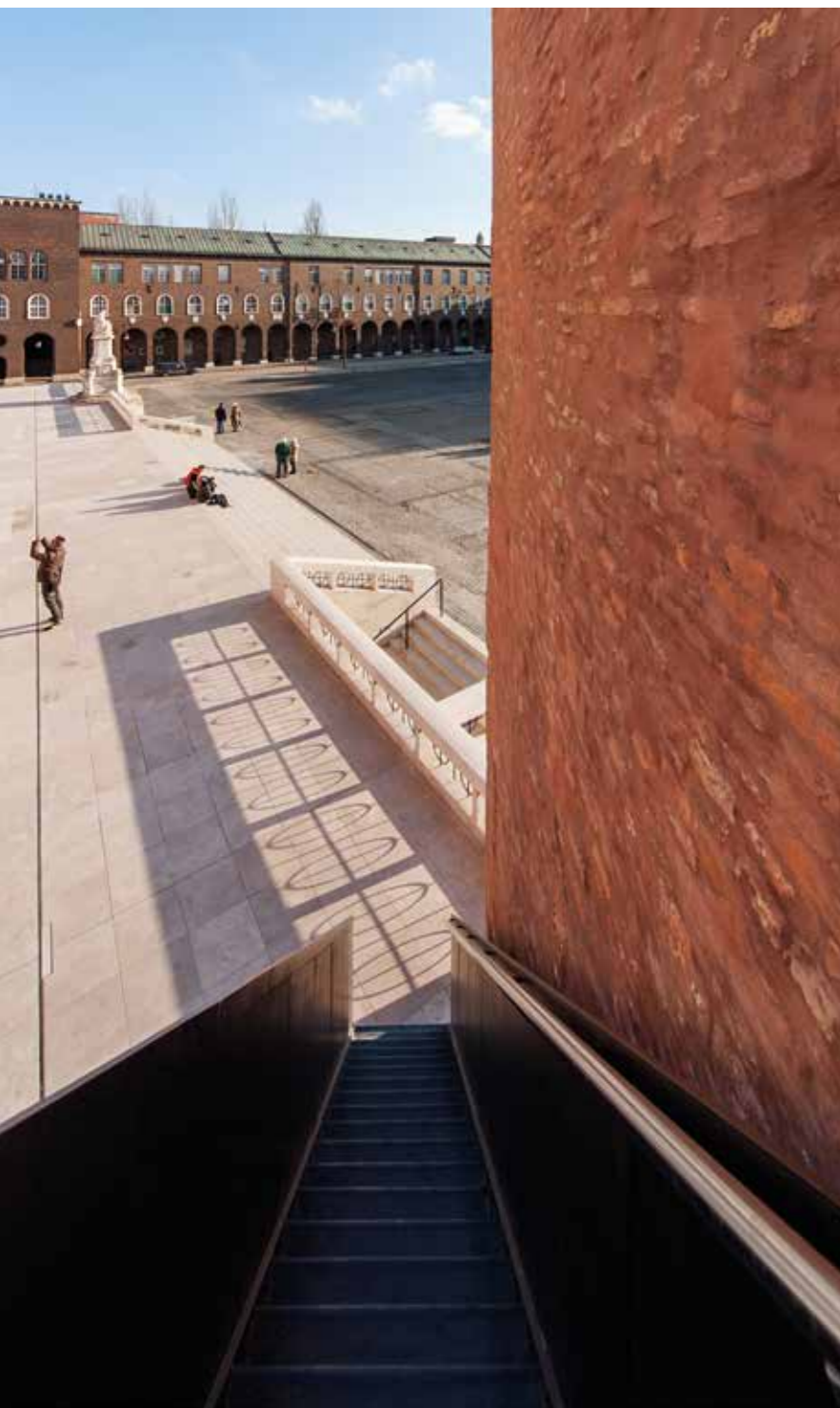
„Látszik, mennyit számít egyetlen építészeti aktus”