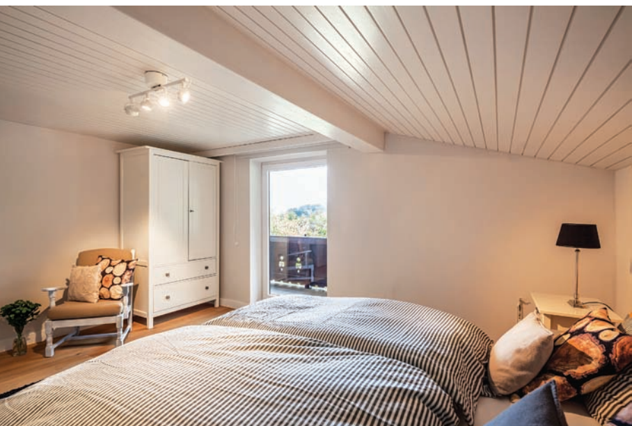
Az eredeti nyers lambéria fehérre festve tágítja a teret