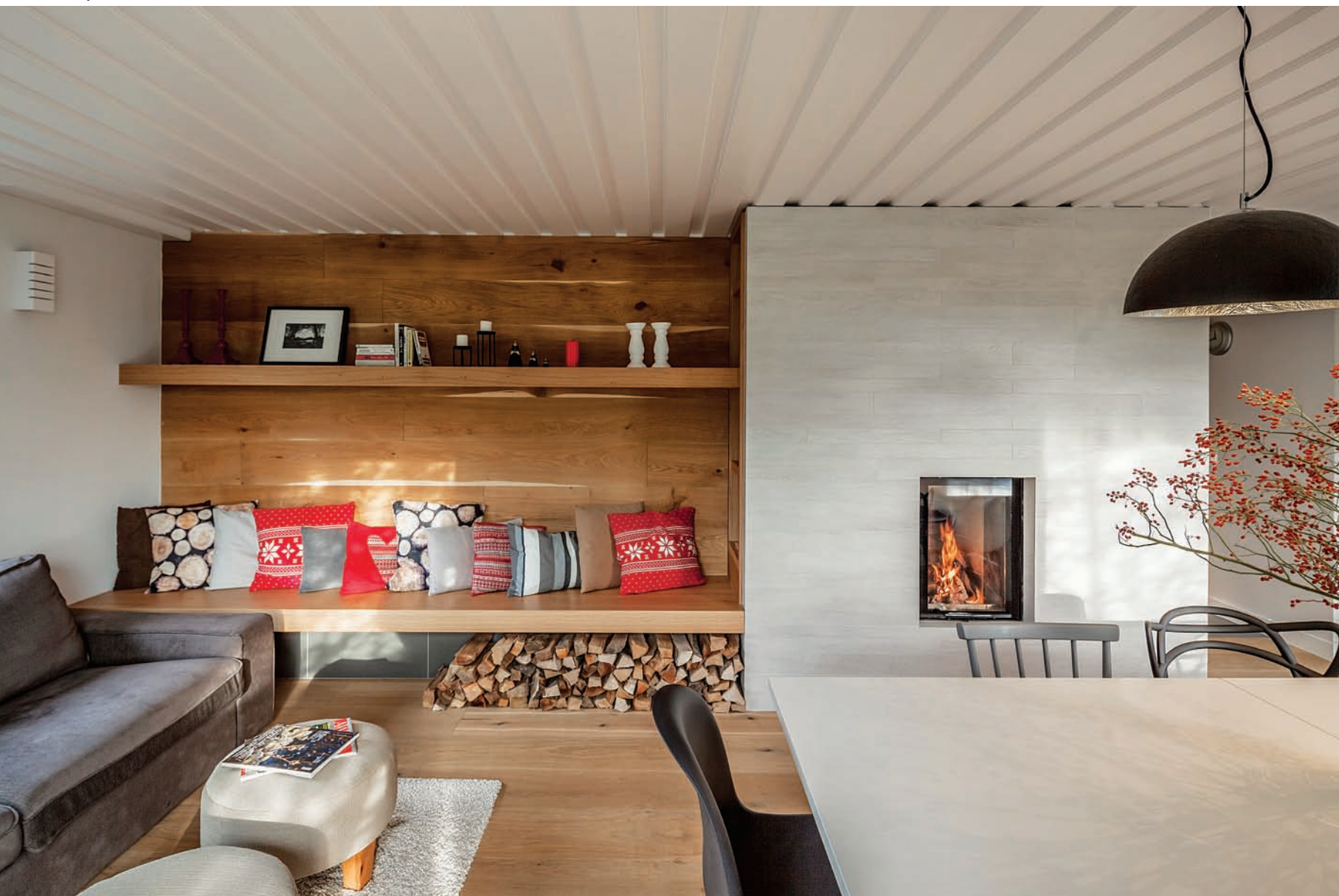
Immár teljes értékű szint a korábbi szuterén, ahol wellness alakítottak ki