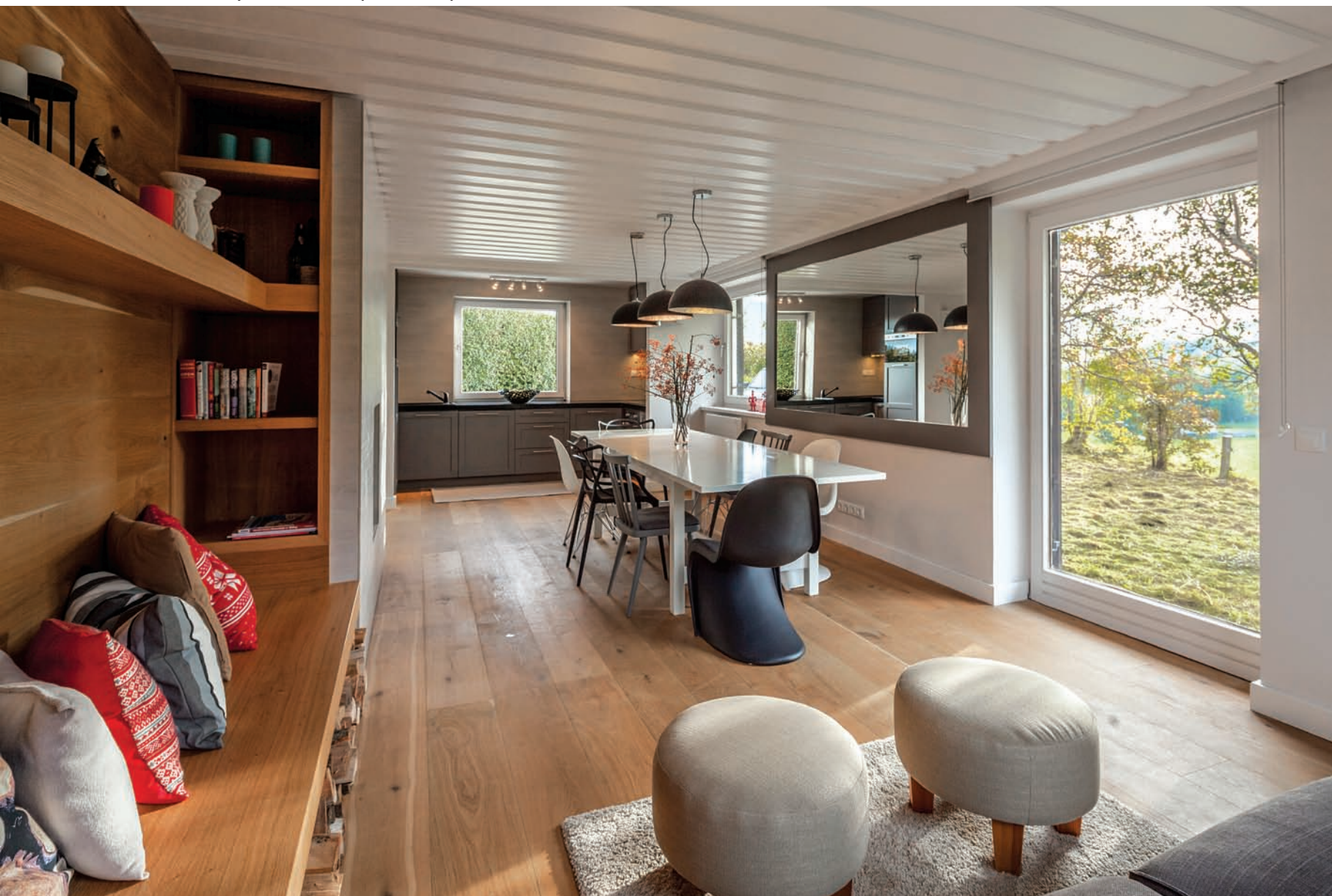
Északi minimál a fenyőbútorok és kötött pulóverek földjén

A hegyi hidegben nem maradhatott kizárólag esztétikai alkotórész a kandalló sem –