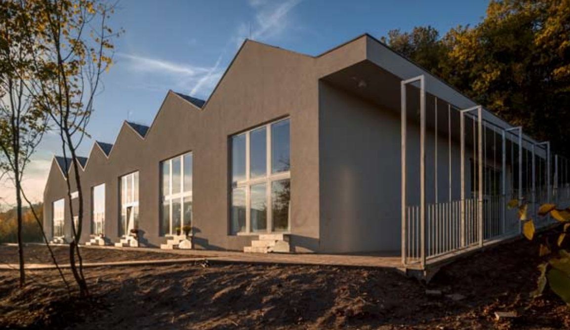
Minden osztályterem hatalmas ablakokat, valamint az udvarra nyíló, önálló kijáratot kapott