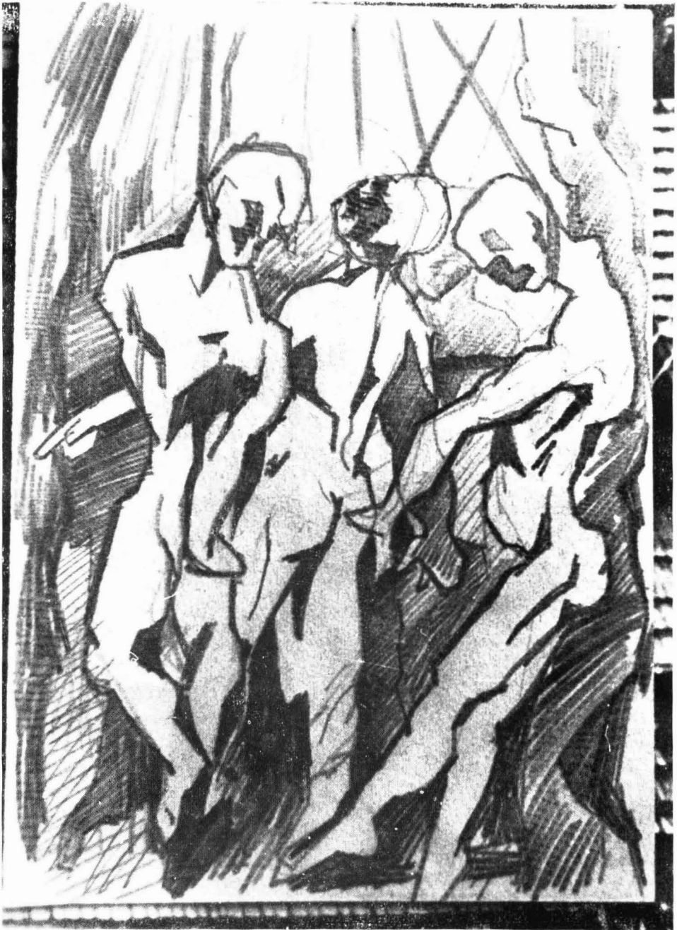
Kondor Béla: Akasztottak balladája