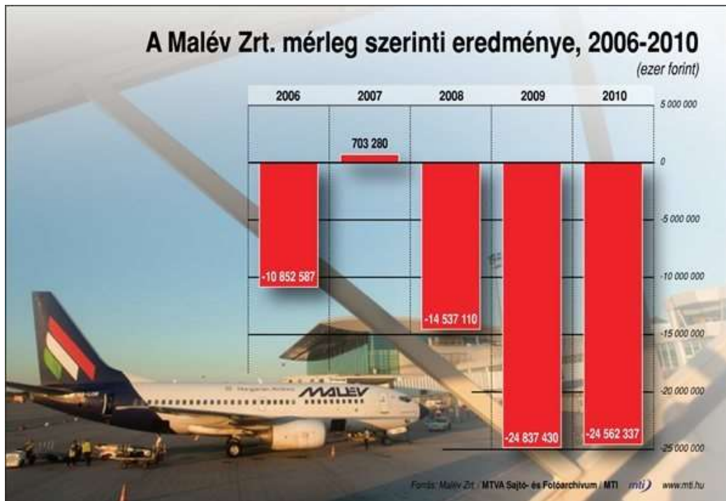
1. ábra A Malév Zrt. mérleg szerinti eredménye, 2006-2010 4

A címben megfogalmazott aspektusból vizsgálva az eseményt, a továbbiakban nem foglalkozom a csödhöz vezető okokkal, csakis arra keresem a választ, hogy a katonai légiszállítási igények maradéktalan kielégítését milyen mértékben befolyásolhatja a Malév csődje, szükséges-e bármilyen azonnali reagálás a Magyar Honvédség mobilitási képességének megőrzése érdekében.