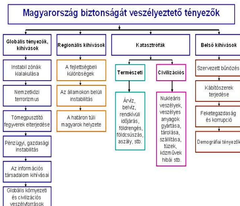
2. ábra (forrás: ZMNE jegyzet)