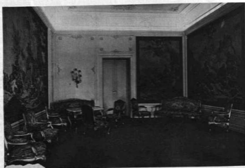
A BUDAVÁRI MINISZTERELNÖKSÉGI PALOTA GOBELIN-TERME