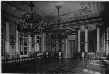
A BUDAVÁRI MINISZTERELNÖKSÉGI PALOTA TÜRÖRTERME