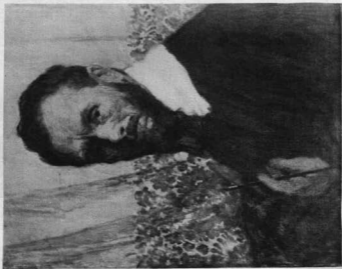
HALÁSZ-HRADIL ELEMÉR: ÖNARCKÉP, 1928