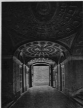
A BUDAVÁRI MINISZTERELNÖKSÉGI PALOTA ELŐCSARNOKA