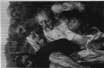
HALÁSZ-HRADIL ELEMÉR: SÍRHATÉTEL, 1926