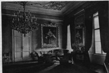
A BUDAVÁRI MINISZTERELNÖKSÉGI PALOTA MÁRIA TERÉZIA TERME