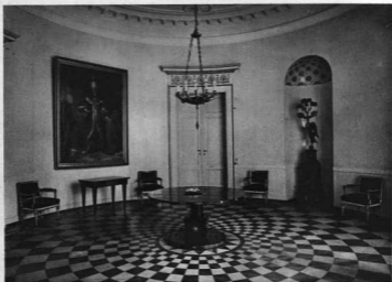
A BUDAVÁRI MINISZTERELNÖKSÉGI PALOTA KERÉK TERME