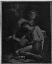
RENI, GUIDO (?) (1575—1642): PIETÀ Első gróf Pálffy János gyűjteményében, ma a „Szlávák Hasi Múzeum”-ban Pozsonyban