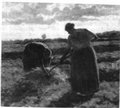
KOSZTA JÓZSEF: A MEZŐN Szépművészeti Múzeum