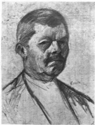
KOSZTA JÓZSEF: ÖNARCKÉP. Rajz