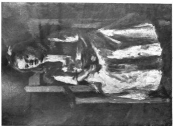
KOSZTA JÓZSEF: MISKATLIS LEÁNY, Olajfestmény Társas Helyett ár 1400000