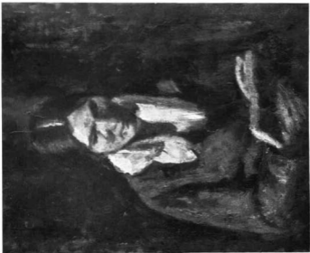
KOSZTA JÓZSEF: OLVASÓ NŐ, Olajfestmény Társas Helyett ár 1400000