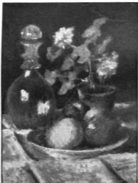
KOSZTA JÓZSEF: CSENDELET. Olajfestmény Frékel Ernő ír tulajdosa