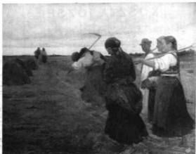
KOSZTA JÓZSEF: HAZATÉRŐK