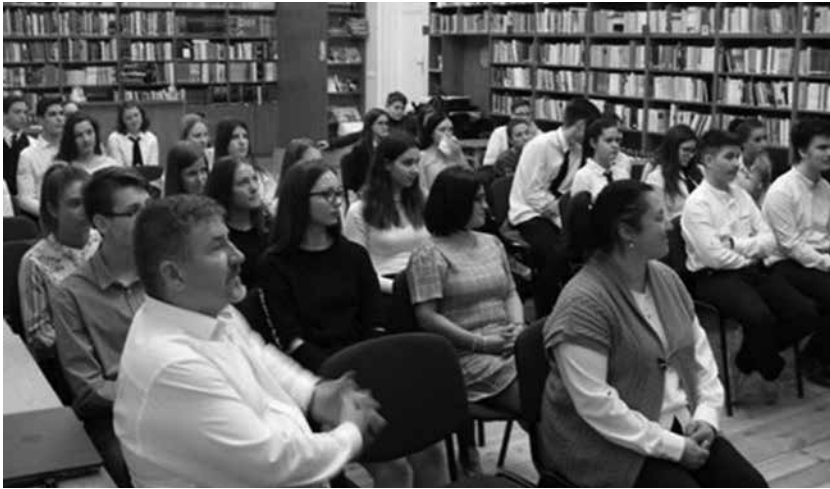
A verseny megnyitója a gimnázium könyvtárában

Azóta sajnos szinte észrevétlenül elrepült felettünk fél emberöltőnyi idő, mely alatt próbáltunk kisebb-nagyobb sikerrel sáfárkodni az itt megszerzett tudással, tapasztalattal.