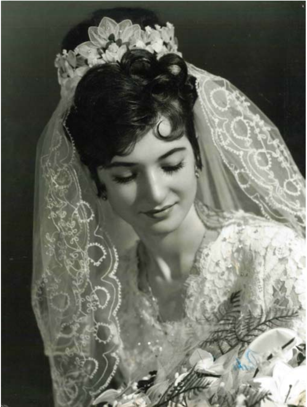
A boldog ara