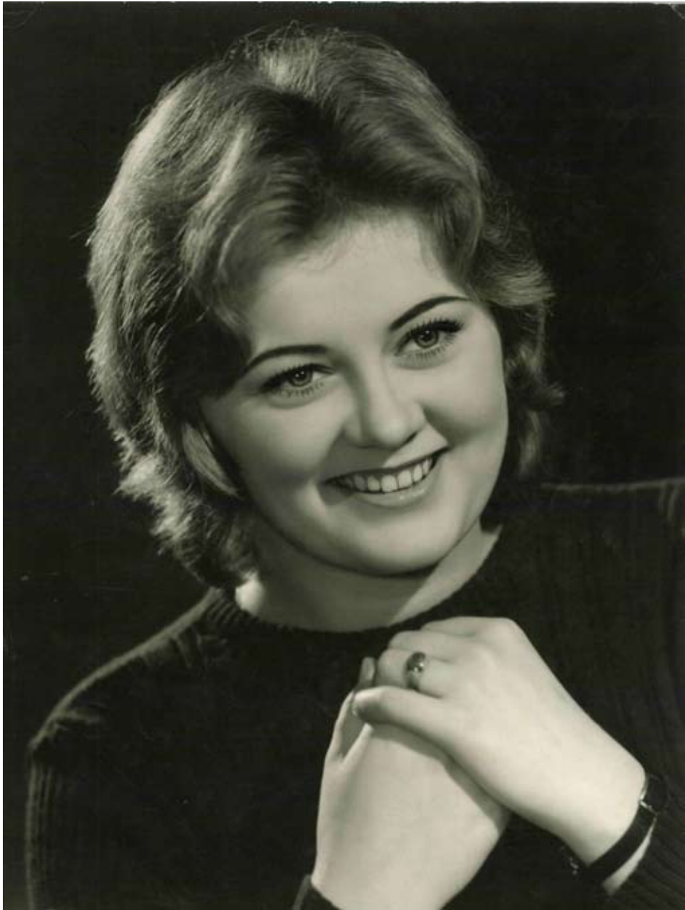
„Ő mindössze tizennégyszer”