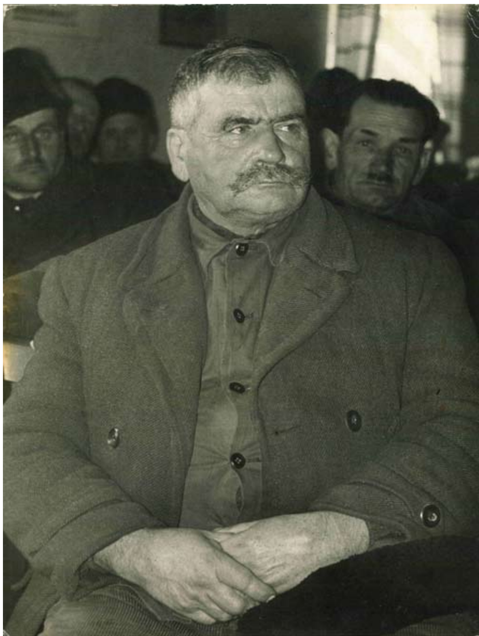
Új tsz-tag a gyűlésen