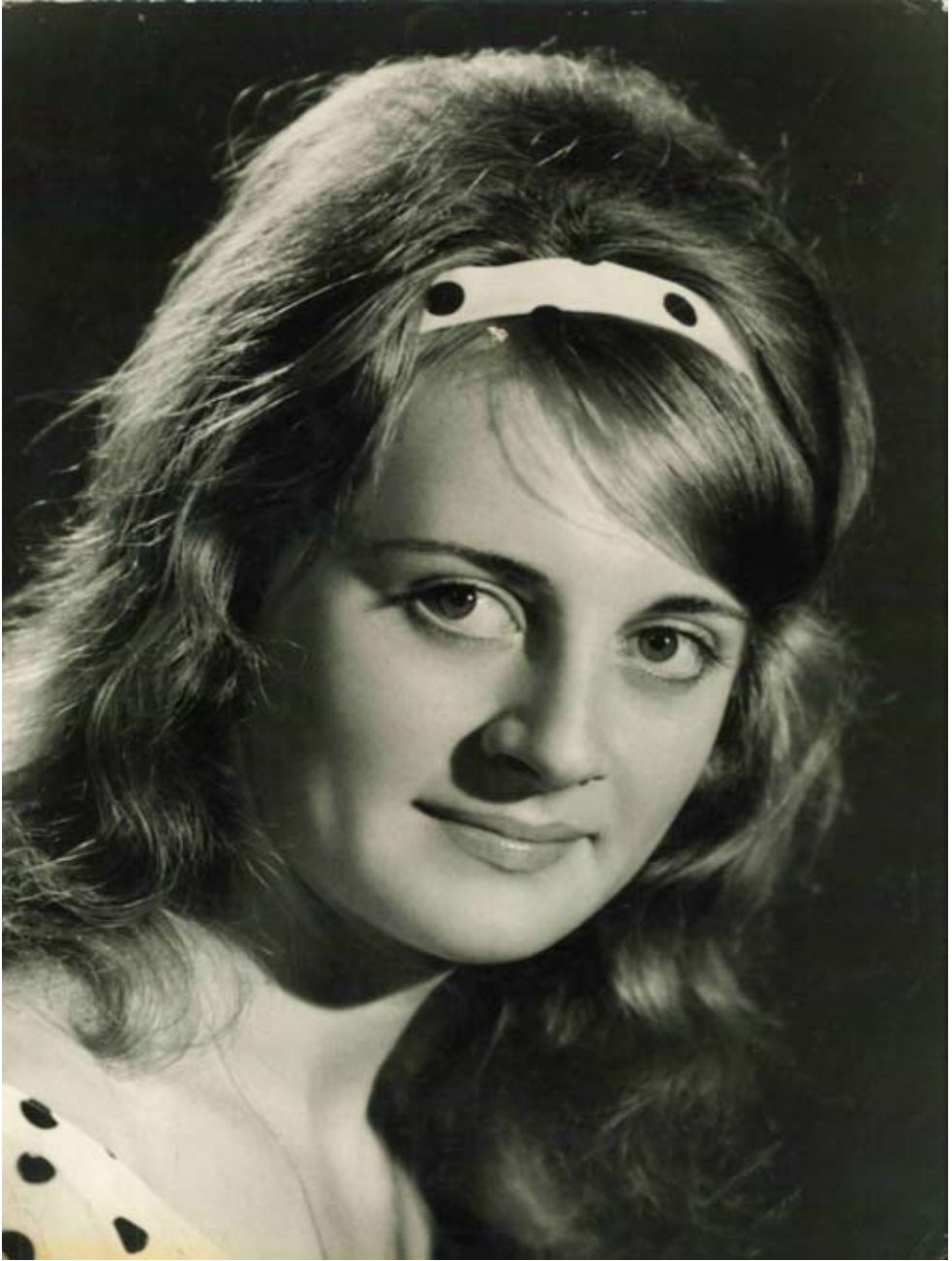
A szép szemű