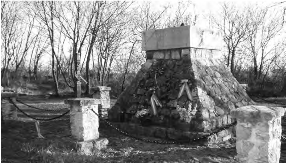
Magyar emlékmű Doberdón

A nemzetközi megemlékezéseken 2007 óta vesznek részt az Olajipari Természetbarát Sportegyesület képviselői. A Doberdón ez év szeptember második vasárnapján immár hetedik alkalommal vonhattuk fel a magyar zászlót, és helyezhettük el koszorúnkat a Monte San Michele emlékművén, amely arra emlékeztet, hogy „ezeken az ormokon olaszok és magyarok vitézül harcolva testvérekké váltak a halálban.” 2013-ban további két helyszínen fejezhettük ki tiszteletünket az elesettek, köztük a magyarok iránt, az Asiagoi-fennsík peremén levő Campiello egykori katonatemetőjében kialakított emlékhelyen, és a Monte Tombán, a Piave-front nevezetes pontján, ahol nyolc nemzet fiai emlékeztek közösen szeptember 1-én.