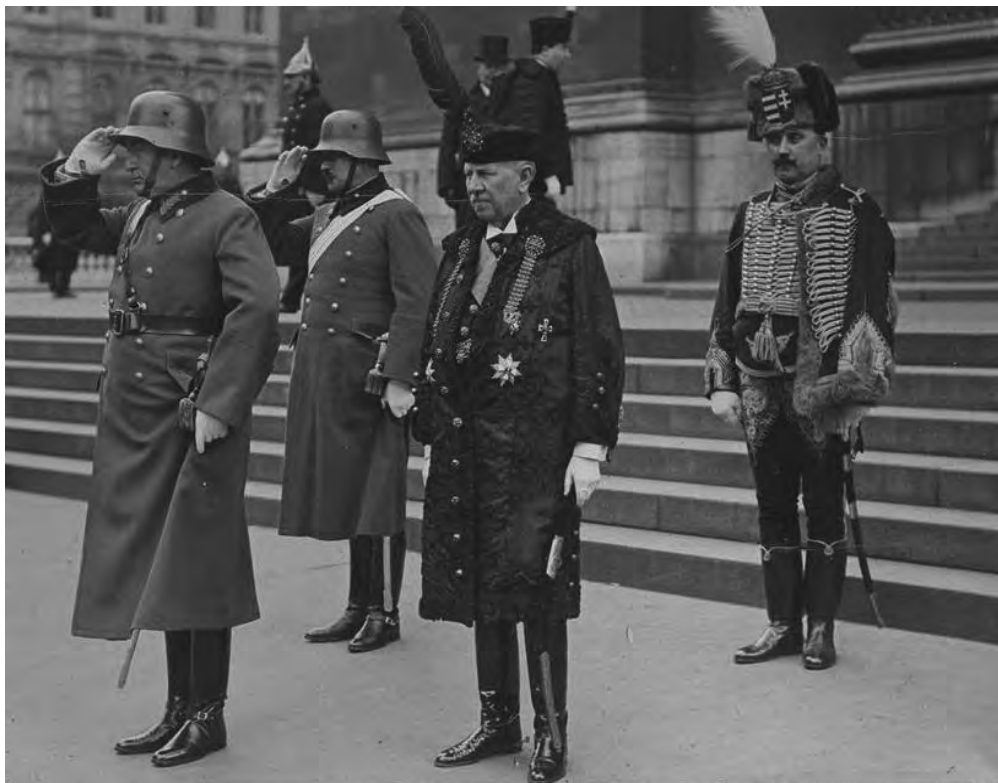
1935-ben a Rákóczi emlékünnepeken