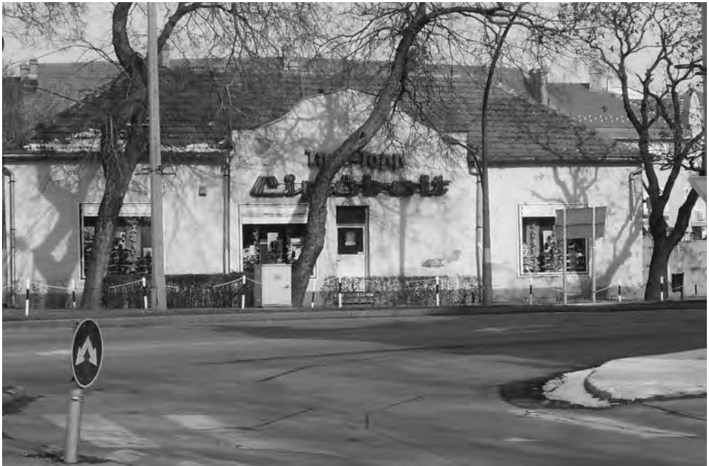
A volt Almásy ház Jászberényben a főtéren