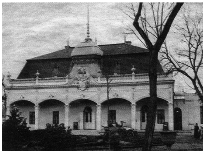
A jákóhalmi kastély