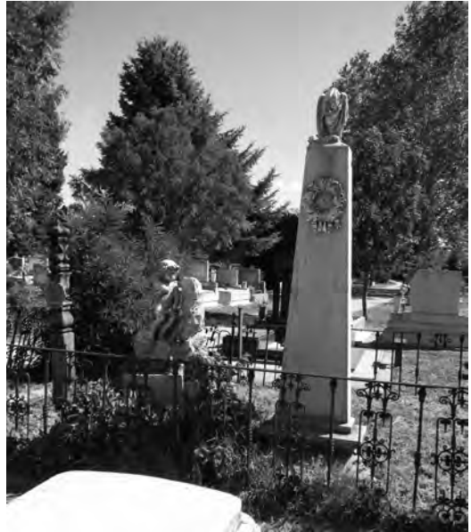
Az Almásy sírkert a Szent Imre temetőben

Almásy László pályafutásának alakulását meghatározta a Jászság és Jászberény történelmi múltja, a helyi viszonyok és kapcsolatrendszerek alakulása. A jászok, a kunok, a Jászság és Kunság népe is elvesztette sajátos, történelmi jogait az önállóság tekintetében 1876-ban. Az új közigazgatási rendszerrel, a vármegyék újrászervezésével, átalakításával Jász-Nagykun-Szolnok vármegye („csinált” megye) létrehozásával sok területen változás, sérelem érte őket. Mind Karcag mind