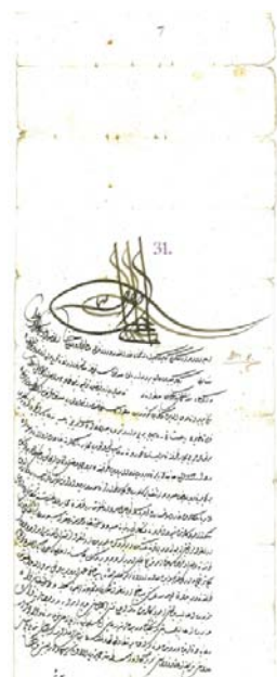
Jászberényi török levelei. Múza budai pasának IV. Murád szultán nevében kiadott tigrás rendelete Moharren szolnoki szandzsákbégnek és a hatvani kádinak. Buda, 1637. október 1-10.

is sok visszaélés történt, amelyért a berényiek panaszt tettek a pasánál. 88 A török katonának az erőszakételhez persze az is elég volt, ha magyar végváriak törtek be a területekre; veszteségeiket a keresztény alattvalókon vetették meg, rajtuk álltak bosszút. Túlkapásaiknak csupán parancsnokuk vagy szolnoki, budai feljebbvalóik józansága és határozottsága szabott határt. Az sem volt ritka, hogy nem a környék, hanem más várak állományából való török katonák lepték el a községet; ettek-ittak, s fosztogatták a lakosságot. 89 A török katonáknak és a szpáhiknak, azaz a török földbirtokosoknak a XVI. században semmi, a XVII. században pedig csak az 1606. évi zsitvatoroki béke – annak is csak a magyar nyelvű változata, a török nem – fogja megtiltani, legalábbis jogi értelemben, hogy a falvakra kimenjenek adóbehajtás céljából. 90 Persze ez a tiltás is jobbra csak papíron érvényesült, hiszen a fentebbi eset – noha ott éppen nem adószedésről volt szó – is ezt példázza. Gyakorlatilag a török adószedő szpáhik és rabló katonák oda nem csaptak ki, ahol a magyar végváriak a szablya erejével érvényt tudtak szerezni a tiltásnak. 91 A tizenöt éves háborúban elpusztult jászberényi török palánkot a hódítók 1618 körül ismét életre keltették, azonban igyekezetük kudarcba fulladt; 92 egy 1621-ben kelt irat említi utoljára a várat. 93