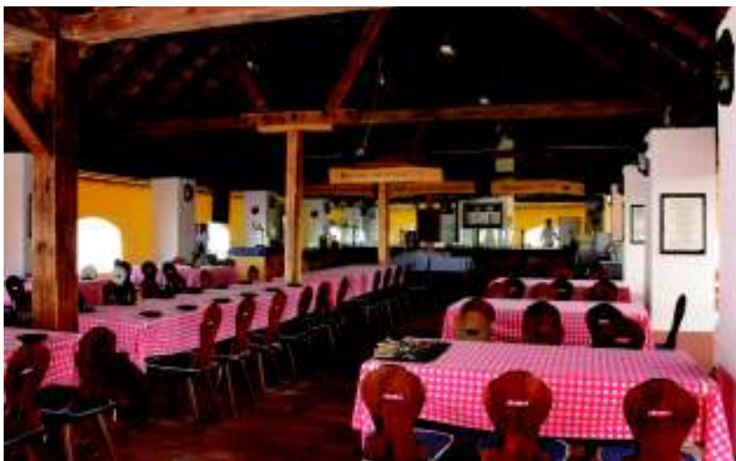
A múzeumi fogadó belső képe

Nagy fájdalomunk, hogy az épület falán nincs a műemléki jegyzékben való szereplésre utaló olyan tábla elhelyezve, amely figyelmeztetne az épület védeltségére. Ezért fennáll a veszély, hogy unokáink már nem gyönyörködhetnek ebben a hangulatos, jellegzetes épületben. Még nagyobb biztonságot jelentene, ha a külső fogadóban, az egykori – a Pest–Eger–Kassa útvonalon elhelyezett – postakocsi állomáson postamúzeum, vagy postatörténeti kiállítás jönne létre. Nem először fordultam kérrrel 2006 februárjában a Kulturális Örökség Minisztériumához és a Műemlékvédelmi Felügyelethez, továbbá a svéd nagykövetséghez. Kértem, hogy helyezzenek el egy, az épületet műemlékként megjelölő táblát, és emléktáblát az épület falára, melyen XII. Károly svéd király ott tartózkodását örökítenék meg. (Akkor még én is abban a tudatban voltam, hogy megszállt nálunk a svéd király.) Azt is kezdeményeztem, hogy postatörténeti kiállítás céljára, postamúzeumként használtsák ezt a jobb sorsra érdemes épületet, melynek jelenleg igen elhanyagolt a külseje, a belseje, az udvara és környezete is. Be kellett azonban látnom, hogy az épület kulturális célokra történő hasznosítására jelenleg nincs esély.