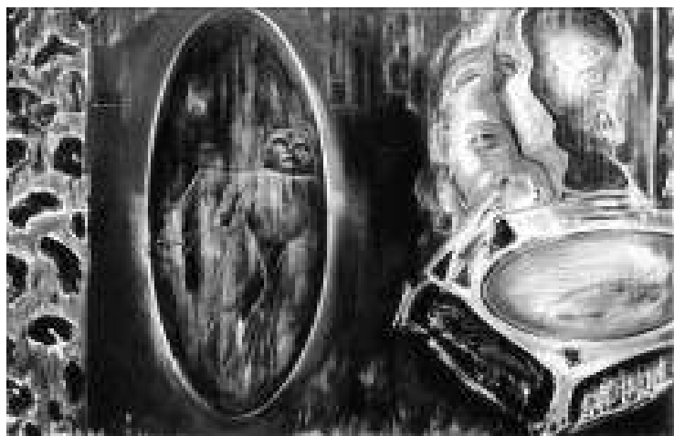
Katona Zoltán festménye

A Kortárs Galériában ez az év volt az utolsó, amikor az Alkotársak kiállítást rendeztek. Az 1995-ös élmény megrázkódtatásai után Palkóék úgy határoztak, új helyszíneket kell keresni a jövőben az Art Camp ügyének folytatásához. A város néhány évre „megfosztatott” a kortársaktól. Viszont mindig akadtak, akik nyitottnak bizonyultak az új művészetek befogadására.