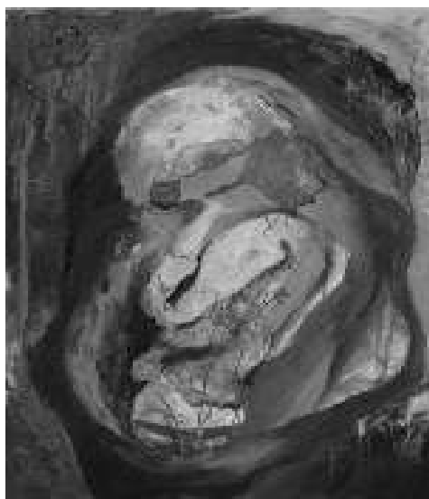
Bartus Ferenc festménye

A műalkotásokra vonatkoztatva kifejti, hogy ez a dolgok „itt” és „most”-jának, az aurának az elsorvadásához vezet. Vagyis a digitális világ nem pótolja teljesen a „jelenléteket”. Egy olyan képi mechanizmus, virtuális tér, amely látszólag mindent pótol, mégis hiányt hagy maga után. Megváltoztatja művészetről alkotott elképzeléseinket, a társas érintkezési formákat, összemossa a társadalmi különbségeket, „egyformásít”, elsöpri a tabukat, módosítja az erkölcsi ítéleteinket, megbontja a tér és időviszonyokat, beépül a legmélyebb tudati régióinkba, álmainkba, vizuális képzeletünkbe. Manipulációra alkalmas eszköz.