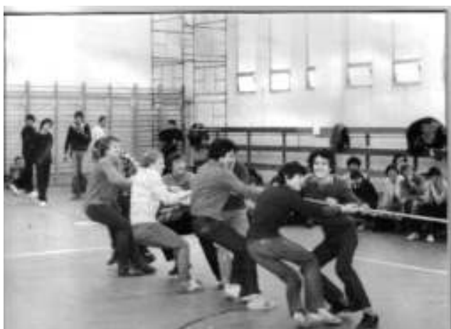
Ti és Mi vetélkedő. A fiúk

5. A pincében, az udvaron a foglalkozások ideje alatt sem szabad dohányozni. Ez érvényes a gimnazistákra és a szakközépiskolásokra is. S ha valakin észreveszik, hogy ivott, ki kell küldeni a klubból, s az iskolai házirend alapján kell eljárni.”