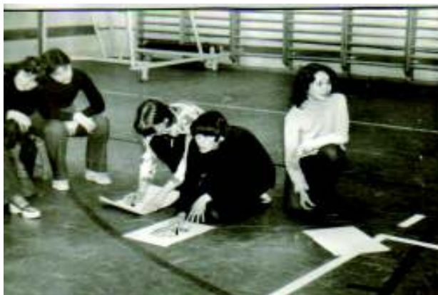
Ti és Mi vetélkedő. A lányok

2. Minden házigazda szerepet vállaló osztály szervezze meg a kapuügyeletet, a klub előkészítését (szombaton), a klubbakarítását (hétfőn).