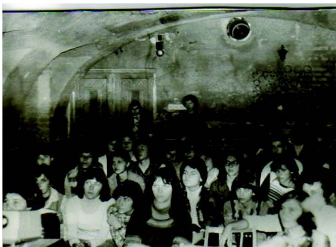
Figyelő tekintetek egy hétköznapi délutáni előadáson

töredékeinket, nehogy végleg elveszenek, s ez által is üresebb legyen a múlt, szegényebb a jelen, s kétesebb a jövő”! A klubfoglalkozásokról naplót vezettünk, több napló telt meg az évek alatt, s ezeket átnézve döbbsentem rá, hogy nem egyszerű dologra vállalkozom, de mindenképpen megéri a munkát, hiszen ez már történelem.