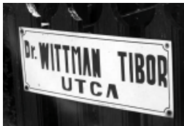
1. sz. kép