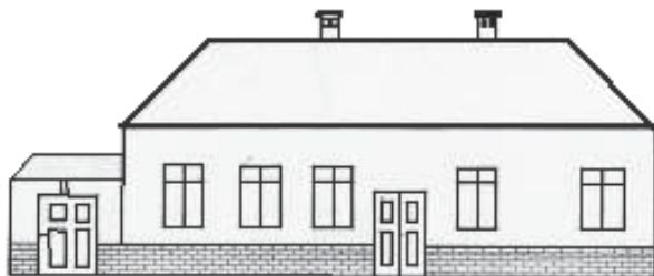
1. sz. kép Az alsóboldogházi elemi népiskola

A fenti nevek és adatok történelmet írtak az alsóboldogháziak életében. Említésre méltó az 1946-os év, amikor is községünk július 1-jén elszakad Jászberénytől, és a Boldogháza, Csíkos, Tápió tanyarészek önálló községgé egyesültek.