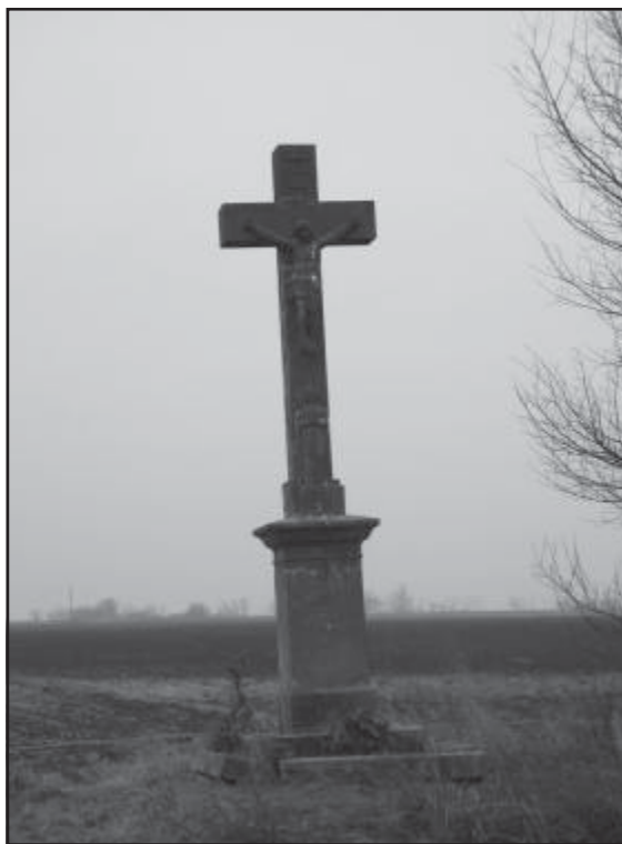
2. sz. kép Az 1905-ben emelt kőkereszt

Az államosítás kérdésében végül is az 1948. XXXIII. tc. szellemében jártak el. Az alsóboldogházi katolikus iskolában az államosításról szóló jegyzőkönyvet 1950. május 27-én vették fel, a miniszteri határozat pedig 1950. július 18-án érkezett meg.