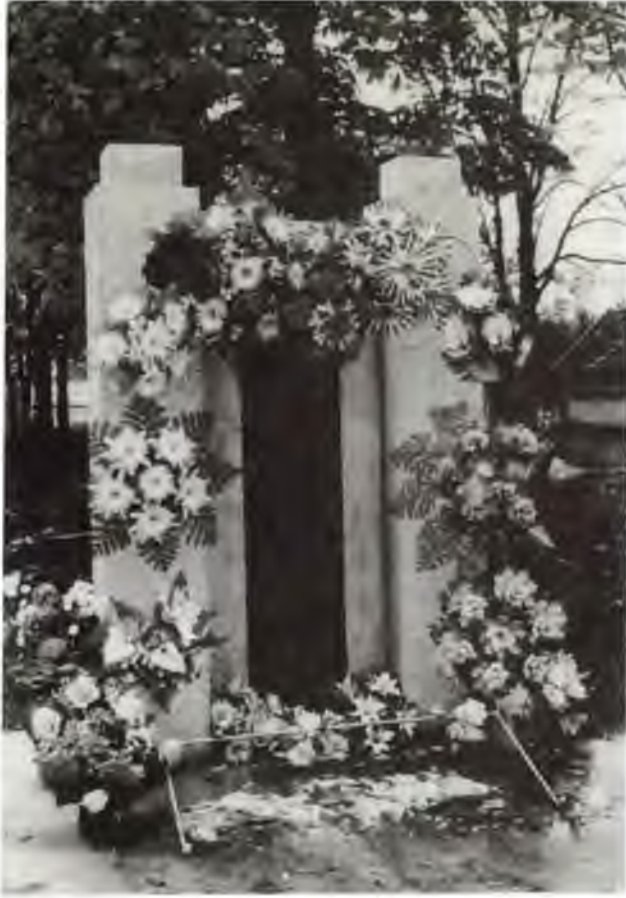
A jásziványi II.-világháborús emlékmű (Avatása: 1991 nyarán)