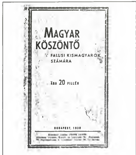
Verseskönyv borítója (1939)