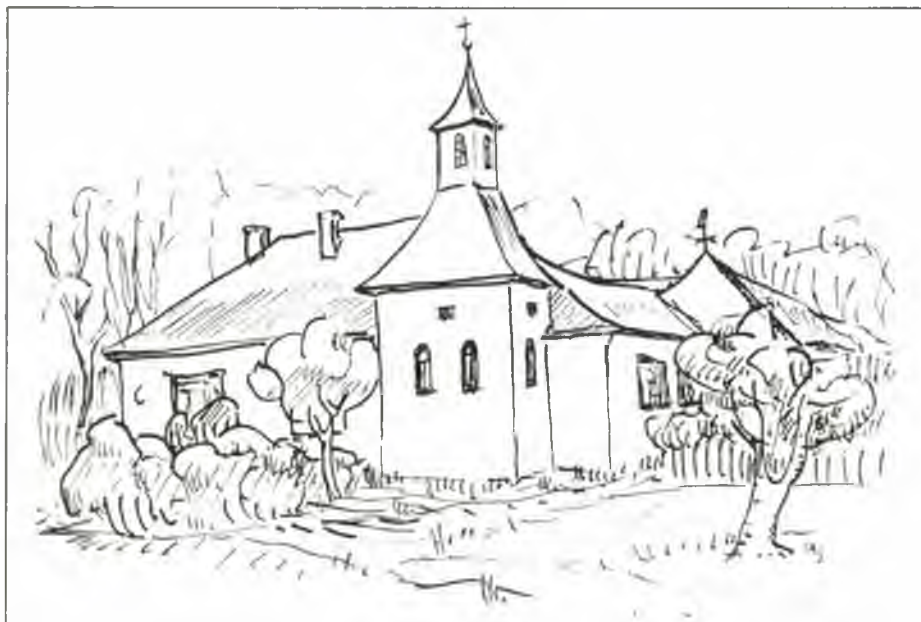
A jászágói általános iskola

Egyik, amelyen nem változtathat, a rendelkezésre álló kiállítási tér növelése. Ha bővíteni lehet valamit, az csak a falakon belüli találékony átrendezéssel, újtással oldható meg. Ezeknek valamelyes dologi kihatása is van. Ilyen lehetőség adódik a gyermekjátékok területén és az ifjúsági mozgalom anyagának új átrendezésében. Előző esetében egyharmadával növelhető a kiállított tárgyak száma, az utóbbinál megfelelő tárlók tervezése, beépítése szükséges, hogy a látnivalókat élvezhetőbbé, vonzóbbá és egyben védettebbé tegyék. Ebben a »megrendelők«, fenntartók segítő akaratával lehet csak előbbre jutni.