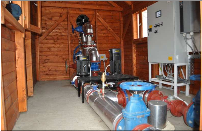
Az Üdülőközpont termálkút melletti gépház belseje

Két fűtőműben a nagyteljesítményű csúcscsazánokat kicseréltük. Az egyik kúthoz telepítettünk egy 50 kW/h nap-elem rendszert, így megújuló energiával termelünk megújuló energiát.