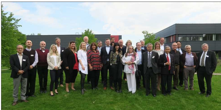
A Nemzetközi Geotermikus Egyesület (IGA) Igazgatótanácsának tagjai Bochumban

Egy, a maga nemében egyedülálló nonprofit intézmény.