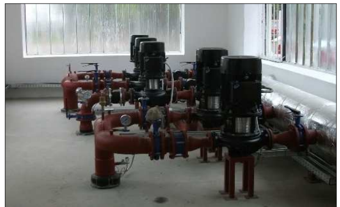
A kertvárosi termálkút szivattyúi