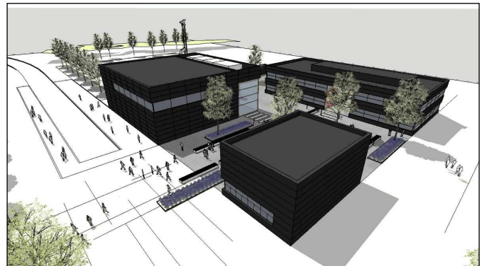
A komplexum látványterve

A Központ működésének finanszírozásában jelentős szerepet vállal magára Észak-Rajna-Vesztfália Tartománya. Mivel az IGA Titkársága is a Bochumi Egyetem falai között talált otthonra, így a tartomány egyben a Nemzetközi Geotermális Egyesület támogatója is.