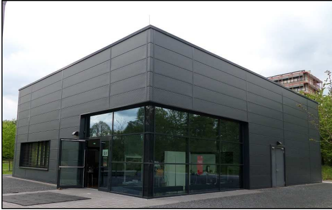
A Nemzetközi Geotermikus Központ egyik épülete

A Nemzetközi Geotermikus Központot 2003-ban alapították, és a maga nemében egyedülálló nonprofit intézmény Európában. Napjainkra a tudomány és az üzleti élet integrált intézetévé vált, körülbelül tizenöt egyetemet képvisel világszerte, és számos közjogi intézménnyel áll kapcsolatban. Rendkívül fontos, hogy a lakosság számára a geotermikus energia hasznosítására és kitermelésére vonatkozó minden kérdésre kiterjedő kompetencia- és információs központként is funkcionál.