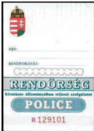
Az 1991. évi szolgálati igazolvány.