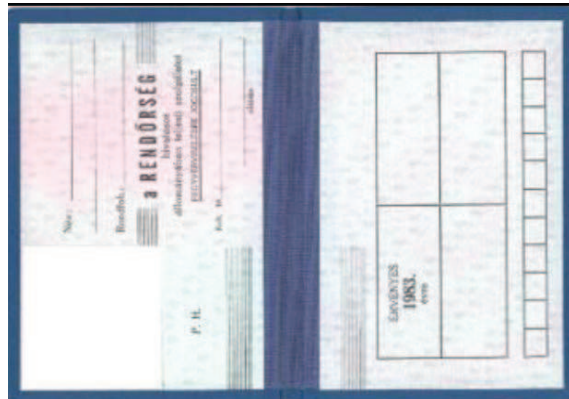
Az 1983-ban bevezetett rendőrségi igazolvány.