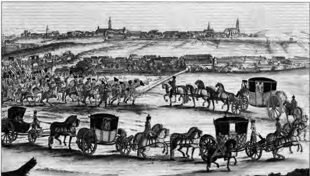
3.2.1. Johann Hieronymus Löschenkohl: A Szent Korona hazahozatala alkalmából kiadott emléklap, 1790. február 21.

Az egyetem távoztával felmerült a várkápolna jogi helyzetének rendezése. Batthyány József hercegprímás, esztergomi érsek 1785. január 12-én tett javaslatával templomigazgatóságot szándékozott felállítani a Nagyboldogasszony-plébánia keretén belül. 44 A császár azonban ragaszkodott patronátusi jogához, és önálló, immár a palota Fehérvári és Vízikapujáig terjedő, területtel is rendelkező plébániát szervezett plébá-