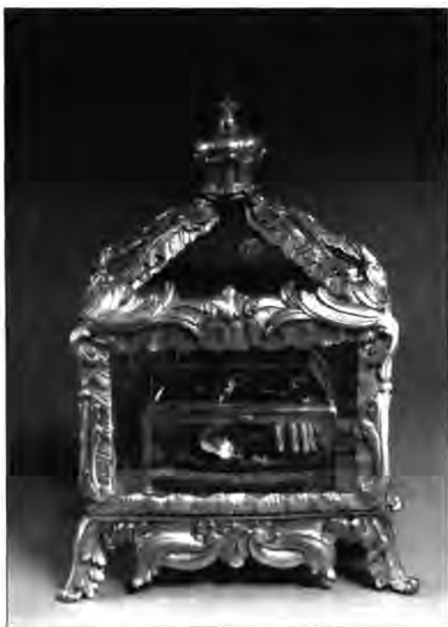
3.1.33. A Szent Jobb-ereklyetartó kicsinyített mása, XVIII. század vége.