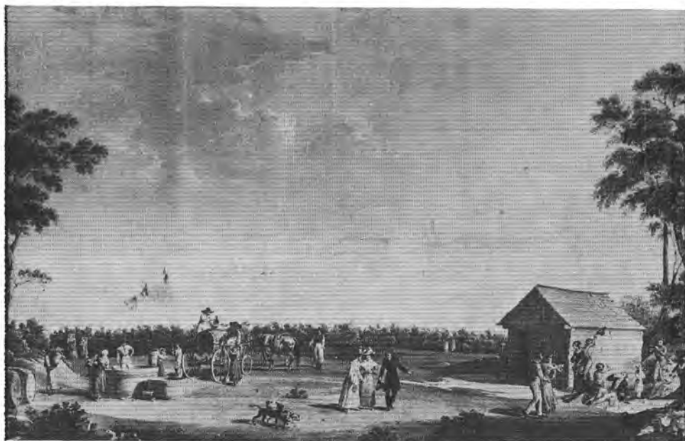
4. Hofbauer János: Szüreti mulatság. Gouache. 1831.

lelkesedéssel, dicséri. Az állásra azonban eleve jelölhetetlen, mivel nem tud magyarul. Franz Mager és Franz Strasser oravicai rajztanítók nem küldtek be mintarajzokat. Ügyükkel így nem foglalkoznak.