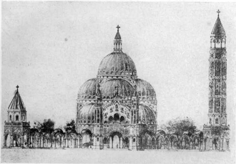
19. A kőbányai templom főhomlokzata (Lechner Ödön első terve).