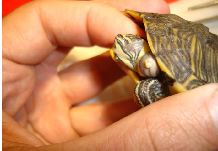
Picture 1: Symmetrical swelling on head of Pseudemys nelsonii in region of the ear canal