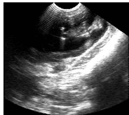
3. kép: 50 napos vehem (5 MHz) Picture 3. 50 days old foetus (5 MHz)