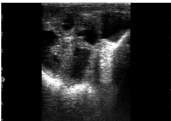
2. kép: 21 napos vemhes méh (6 MHz) Picture 2. Pregnant uterus on day21 (6 MHz)

Buckrell és mtsai (1986) szerint a 25. vemhességi naptól a pozitív vemhességi eredmény 97%-os, míg a negatív csak 80%, 91%-os pontossággal becsülhető. A kilencvenes évek elején a valós idejű B mód ultrahangos vizsgálattal a 24-34. napok között végzett vemhesség ellenőrzés adta a legmegbízhatóbb eredményt (Garcia és mtsai, 1993).