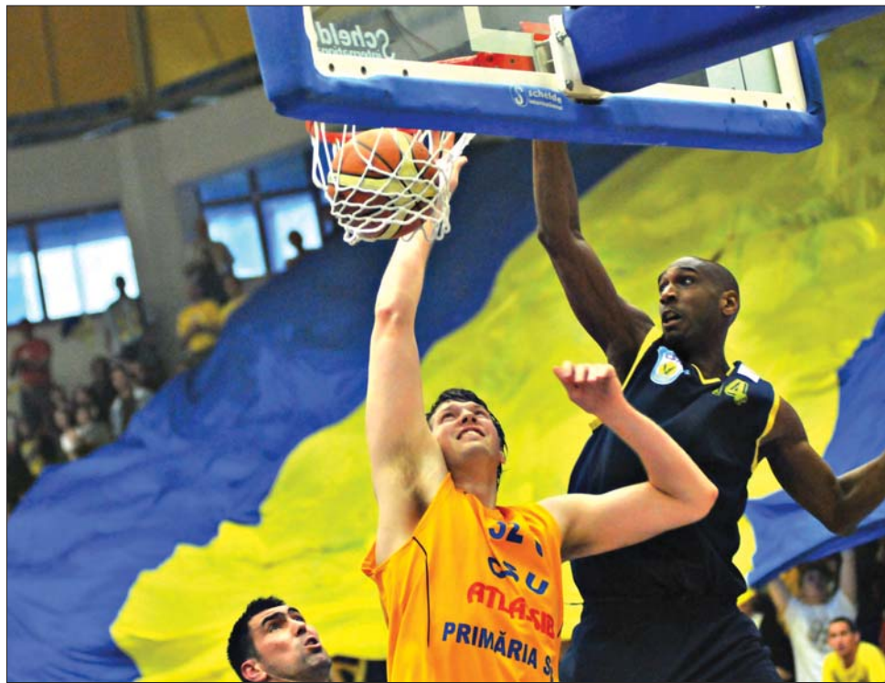
A Nagyszebeni CSU Atlassib (sárga mez) 82-71-re győzte le a BCM Argeş Piteşti együttesét.

A többi nyolc együttes a kiesés elkerüléséért küzd az alábbi párosításban: CS Otopeni–Brassói CSU Cuadripol (1), Energia Rovinari–Politehnica Iaşi (2), Temesvári BCM–Csíkszeredai Hargita Gyöngye BC (3) és CS Municipal Bukarest–SCM U Craiova (4). Az első körben három sikerig játszanak, a négy győztes nem folytatja. A 13-16. helyezettek 1-4 és 2-3 párosításban legtöbb öt mérkőzést vívnak, a két vesztes kiesik, sorrendjüket pedig két győzelemig tartó párharcban döntik el. A 13-14. helyezettek többször nem lépnek pályára. ◀