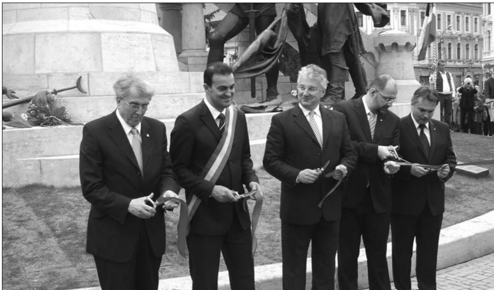
Szalagvágás: Fellegi Tamás, Sorin Apostu, Semjén Zsolt, Kelemen Hunor és László Attila

A végig két nyelven – magyarul és románul – zajló ünnepségen Sorin Apostu polgármester és László Attila alpolgármester kiemelték, Fadrusz János nagyszerű alkotása a román és a magyar állam együttes támogatásával újult meg, az eredményes és a közösség számára hasznos együttműködés példaként. Semjén Zsolt magyar miniszterelnök-helyettes úgy fogalmazott: a Mátyás-szoborcsoport háromszoros szimbólum. „Az egyik magának Mátyás királynak a személye, aki nemzeti önkifejeződésünket testesíti meg. A szoborcsoport egyben a magyar megmaradás szimbóluma, hiszen kiállta a történelem viharait, túlélte a Ceaușescu-féle rombolást, akárcsak a Ceaușescu-epigonok rombolási kísérletét. A szobor restaurálásának története pedig a román-magyar együttműködés fontosságát szimbolizálja” – sorolta a jelképeket a miniszterelnök-helyettes. Réthelyi Mik-