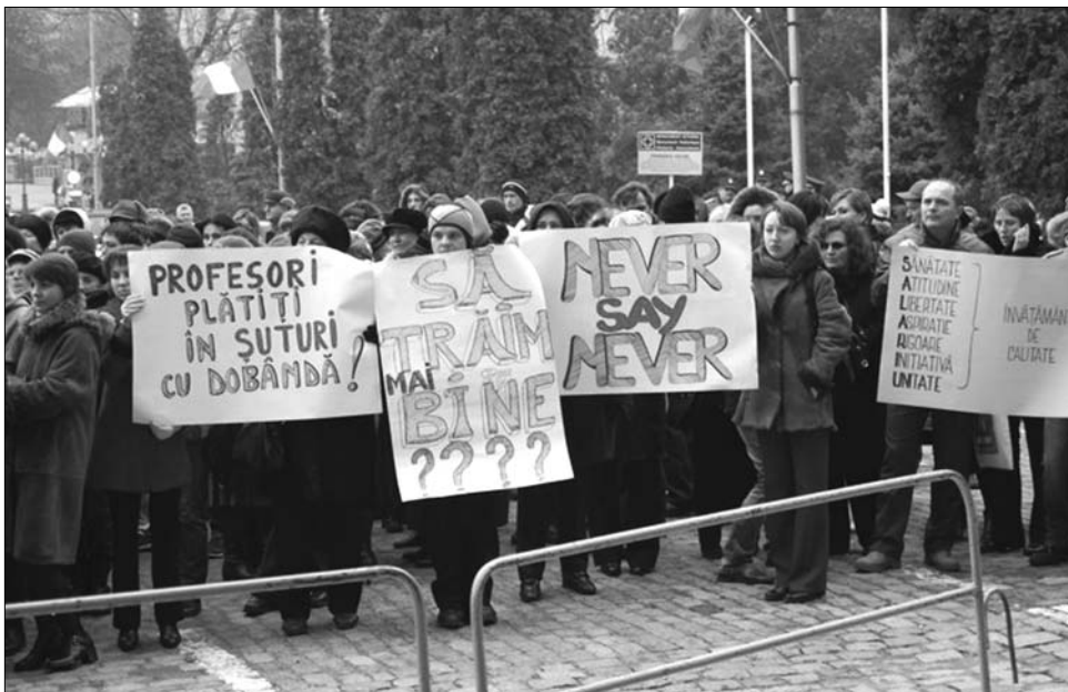
Elfogyott a türelmük. Bíróságon elnyert béremelésükért tüntetnek a botoșani-i pedagógusok

A bérvitát az a 2008-as parlamenti döntés indította el, amely révén a korabeli választási kampányban a törvényhozók megszavazták a pedagógusok fizetésének 50 százalékos emelését. Ezt a szokatlanul nagymértékű emelést kormány szinte azonnal hatályon kívül helyezte, és egy újabb rendeletet fogadott el, amely 17 százalékra korlátozta a béremelést. Kiderült, hogy nincs elegendő pénz az államkasszában az 50 százalékos növeléshez, ezt pedig a törvényhozás figyelmen kívül hagyta. A béremelést felfüggesztő kormányrendeletet azonban alaptörvénybe ütközőnek nyilvánította az Alkotmánybíróság, ami arra ösztönözte a pedagógusokat, hogy a bíróságon szerezzenek érvényt a korábban megígért 50 százalékos bérmódosításnak. Az oktatási minisztérium szerint több mint 10 ezer pedagógus nyerte meg bíróságon az 50 százalékos béremelésért indított pert. A kormányfő viszont hangsúlyozta, hogy az állam képtelen kifizetni a bíróság által megítélt emelt fizetéseket, hiszen ez félmilliárd euró pluszterhet jelent a költségvetés számára csak 2011-ben, erre pedig a kormány