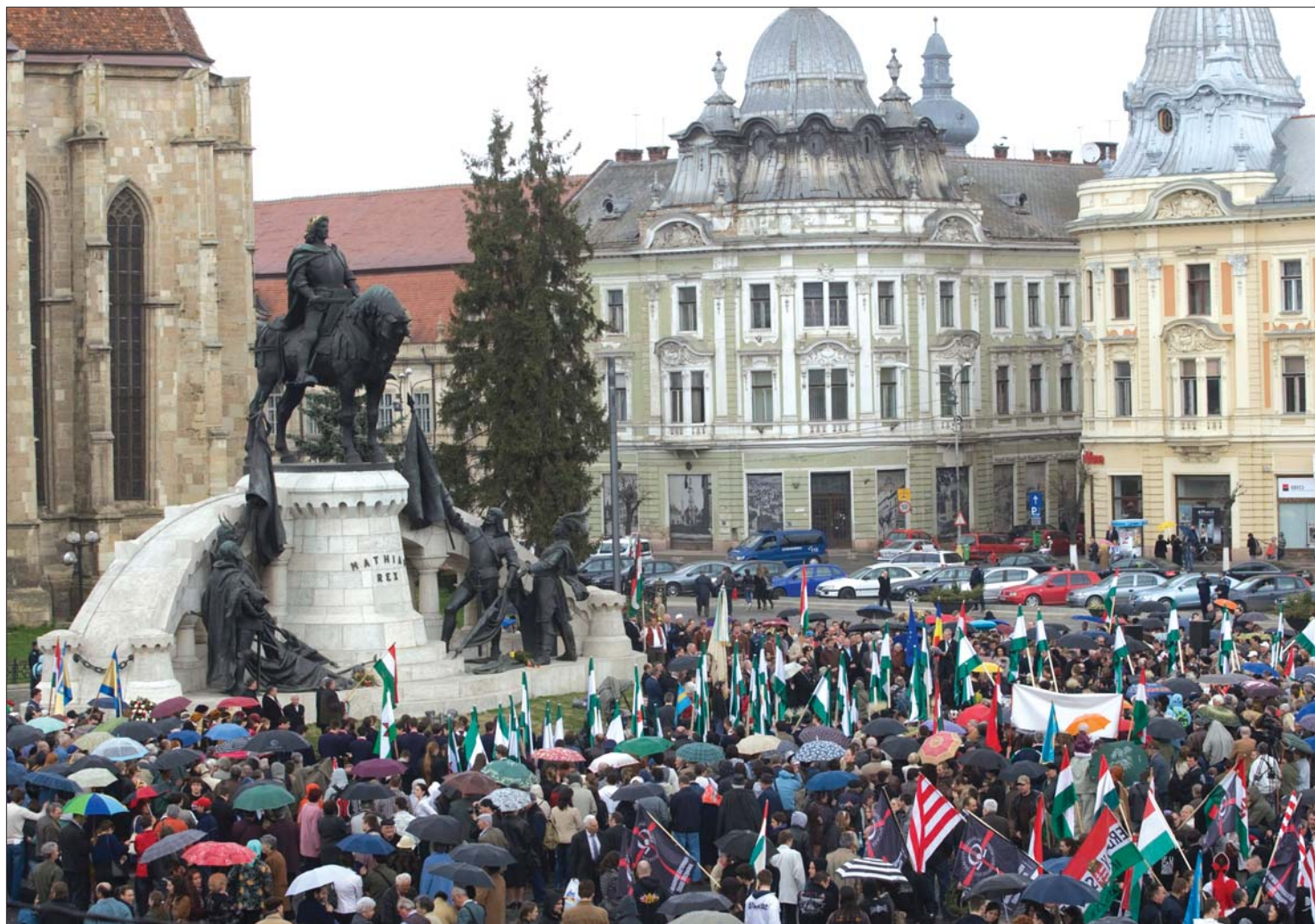
Mátyás és ezer „alattvalója”. A szombati hivatalos szoboravatón megtelt a Fadrusz-alkotás előtti tér a kincses város központjában

Hivatalosan is átadták a hét végén Kolozsváron a felújított szoborcsoportot