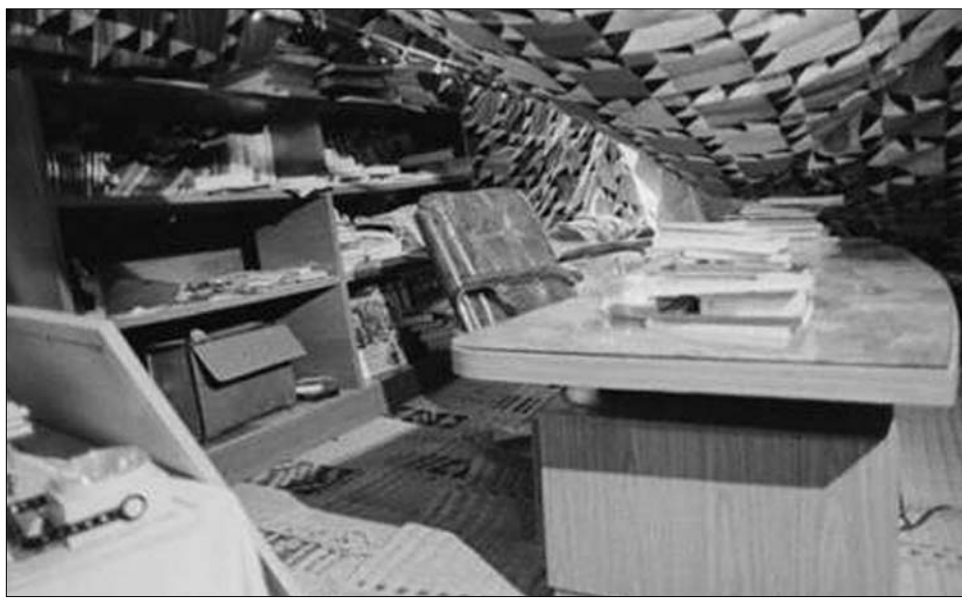
Moammer el-Kadhafi bunker-dolgozószobája. Luxus helyett biztonság

Itt található a vastag betonfallal védett bunkerépület, amelyet oly sokan a forradalmi vezér és családja búvóhelyének feltételeznek. Vajon innen küldözgeti örült telefonos fenyegetéseit, hogy „az utolsó véráldozatig küzdeni fog”, s hogy „a Földközi-tenger egész térségét megszárszéké fogja változtatni”? Sok minden szól emellett. Amikor a légitámadások elkezdődtek Tripoli ellen, megnyíltak az egyébként hermetikusan lezárt terület kapui. Kadhafi híveinek ezrei tódulhattak be az első védőfalon keresztül. Méghozzá cinikus megfontolásból: a mintegy „emberi védőpajzsot” alkotó polgári személyek jelenléte megakadályozhatja a légitámadást. Kadhafi „hosszú háborúval” fenyegetőzött. Amennyiben valóban a bun-