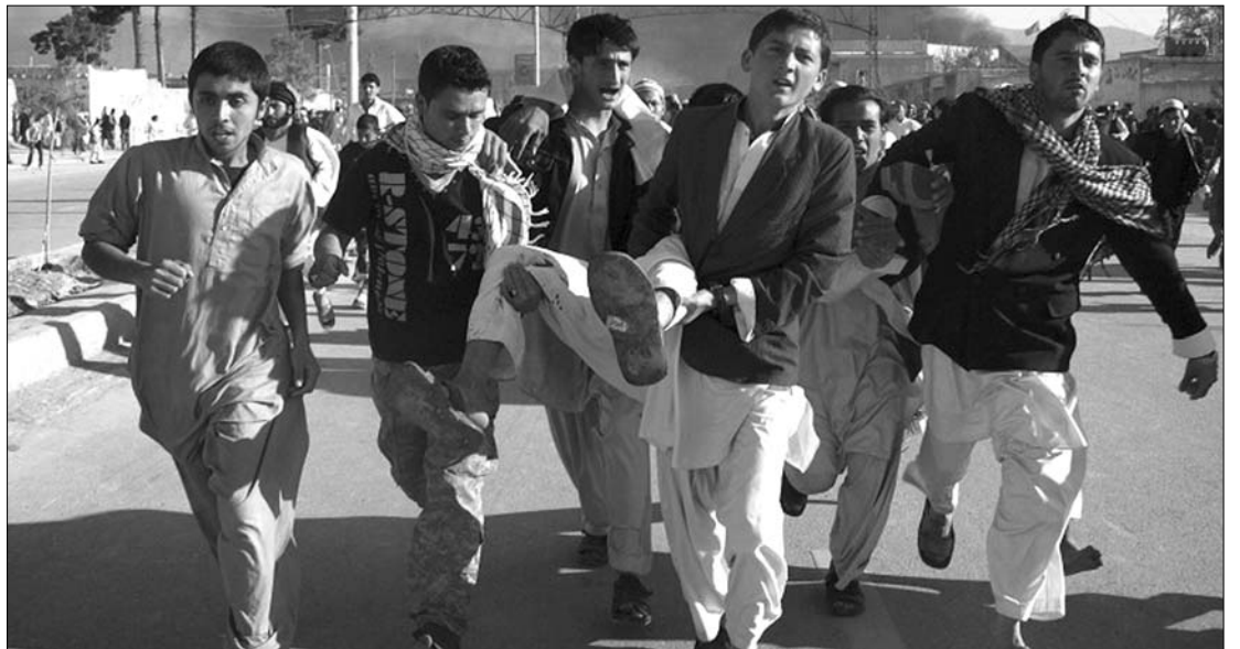
Fiatal tüntetők egy sebesült társukkal. Azon háborodtak fel, hogy Floridában egy lelkész elégetett egy Korán

Az ENSZ-kirendeltségnél a pénteki ima után tüntetést tartottak, tiltakozásul amiatt, hogy az Egyesült Államokban a hírek szerint egy lelkipásztor márciusban elégette a muzulmán szent könyv, a Korán egy példányát, amit Hamid Karzai afgán elnök nyilatkozatban ítélt el. A tüntetők egy csoportja tüzet nyitott az örökre, majd behatolt az épületbe