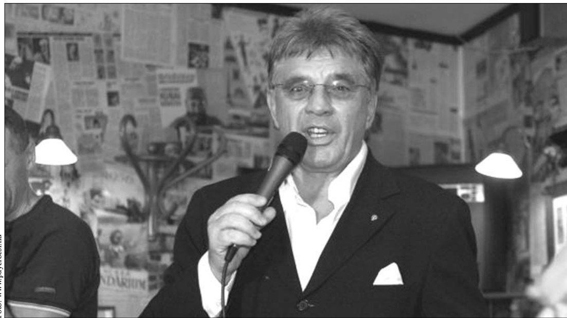
Payer András év elején még hármas jubileum ünneplését tervezte júliusra, hetvenedik születésnapjára

► Súlyos betegség után, csütörtökön elhunyt Payer András az Ó, egy Alfa Romeo és a Gedeon bácsi című számok szerzője és előadója. A hatvanas évek könnyűzenei életének a meghatározó alakja 1941. július 31-én született Budapesten. Apja hivatását folytatva ő is gyógyszerész lett, de 1961-től elkezdett foglalkozni a zenével. Jóformán az egész magyar élvonal énekelt, illetve énekli dalait, Hofi Géza első sikeres nagylemezének jelentős részét is ő írta. Az együttesek közül az 1960-as és 1970-es években az Omega, az Illés, a Bergendy együttes, valamint a Magyar Rádió Big Bandje is műsorán tartotta a Payer-dalokat, akárcsak később a fiatalabb generáció együttesei (Cotton Club Singers, Republic). Legnépszerűbb szerzeményei: Ó, egy Alfa Romeo, Arnyai arc ismerős, Találkozás, Gedeon bácsi, Könyvek nélkül, Felmegyek hozzád, Még egyszer, Almát eszem, Nincsen olyan ember, Isten veled szomorúság, Nem születtem grófnak. Számos színdarab-