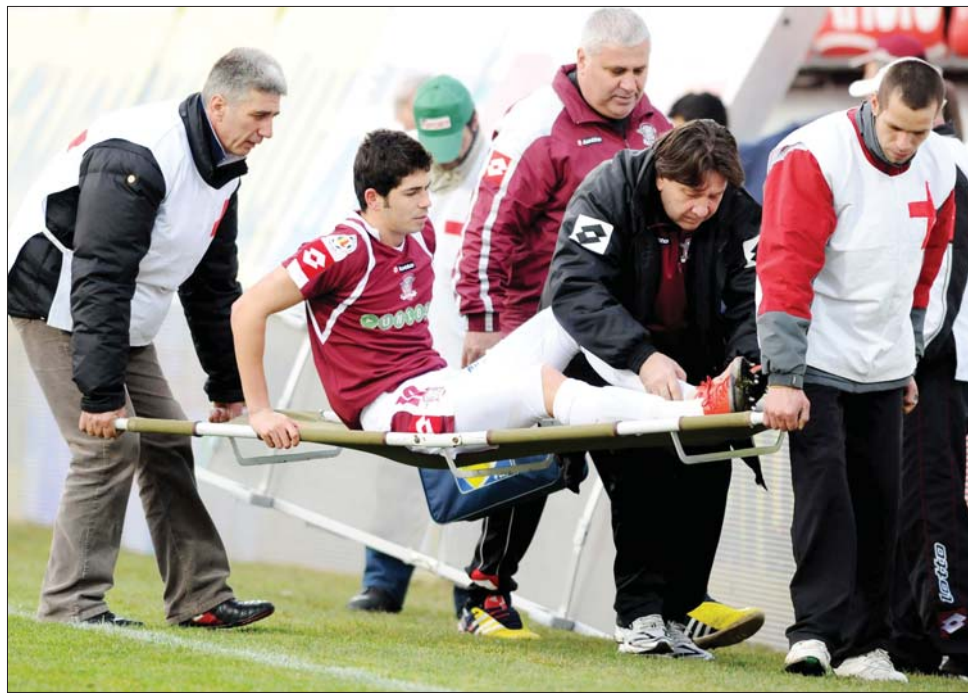
A kisebb klubok nem tudják megtéríteni a sportorvosi ellátással járó költségeket

Ilyen körülmények között nem véletlen, hogy az élsportolók a külföldi magánklinikákat választják. Többségük Bologna felé vette eddig az irányt, most azonban már Marosvásárhelyen is van egy magántőkéből felépült, modern gépekkel ellátott rekuperációs központ. A pár nappal ezelőtt megtartott avatóünnepségén a bolognai klinika vezetője, Alessandro Zati és a sportolók rekuperációjára szakosodott orvos, Domenico Creta is részt vett. Utóbbi nagyon optimistán nyilatkozott, szerinte ennek a központnak a megnyitásával a szakág jelentős változásokon esik majd át. ◀