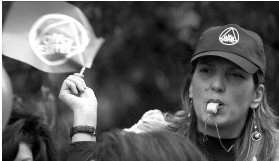
Az egységes bértörvény és a nyugdíjtörvény ellen tiltakoznak az Alfa Kartell tagjai