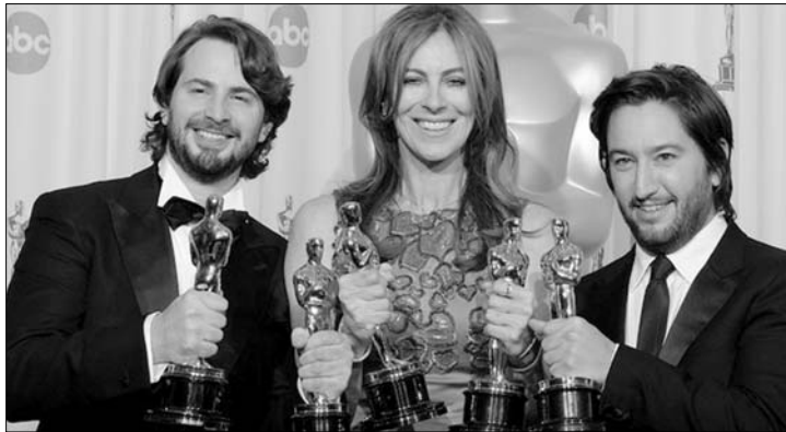
Kathryn Bigelow (középen) az első legjobb női rendező a díj történetében

A 82. Oscar-gálára sok újítást és nagy pörgést ígértek a rendezők, de valljuk be, a tavalyi házigazda, Hugh Jackman látványos ének és táncjelenetei után, idén a Steve Martin–Alec Baldwin párosnak nehéz dolga volt. Fergetes nyitóképben azonban most sem volt hiány, Jeff Bridges, Sandra Bullock, George Clooney, Helen Mirren, Colin Firth, Carey Mulli-