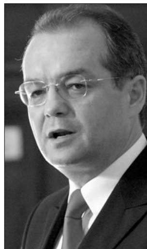
Emil Boc garantálta a fizetést

A felmondási listán fontos szakszervezeti vezetők is szerepelnek, akikről nem feltételezem, hogy valóban távozni szeretnének” – tette hozzá az AJOFM Kolozs megyei vezetője. Ha mégis komolyak lennének az autópályá-építő kollektív elbocsátási szándékai, a munkaügyi hivatal minden törvényes lépést megtesz azért, hogy a Munkatörvénykönyvnek érvényt szerezzen. Úgy tűnik, Donnak igaza lett, Emil Boc miniszterelnök, miután tegnap délután a Victoria palotában folytatott tárgyalást a Bechtel vezetésével, azt nyilatkozta: a kormány és a vállalat aláír egy megállapodást áprilisban a munkálatok folytatásáról az erdélyi autópályán, s egyben rendezti az amerikai építő felé az adósságai következő részletét. Eszerint 2010-ben a sztrádából újabb húsz kilométer épül meg, s a cég megtartja az alkalmazottai háromnegyedét. Mint korábban beszámoltunk róla, egy