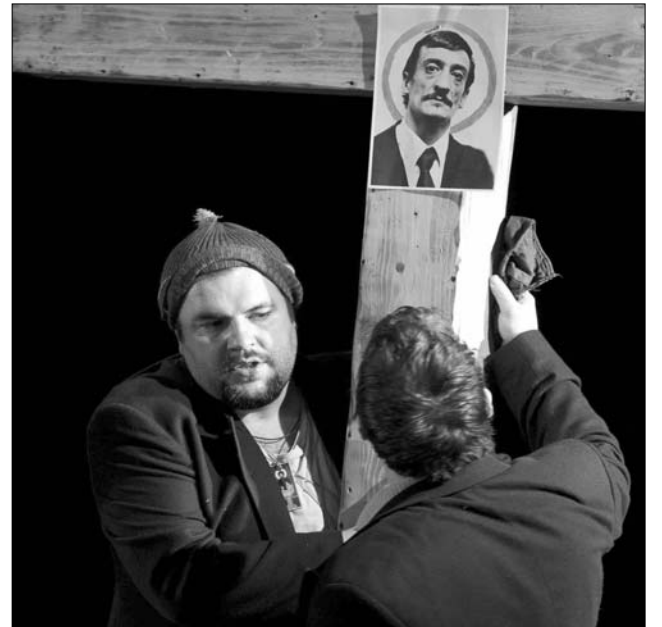
Az Ilja próféta eredeti bemutatója 2001-ben volt