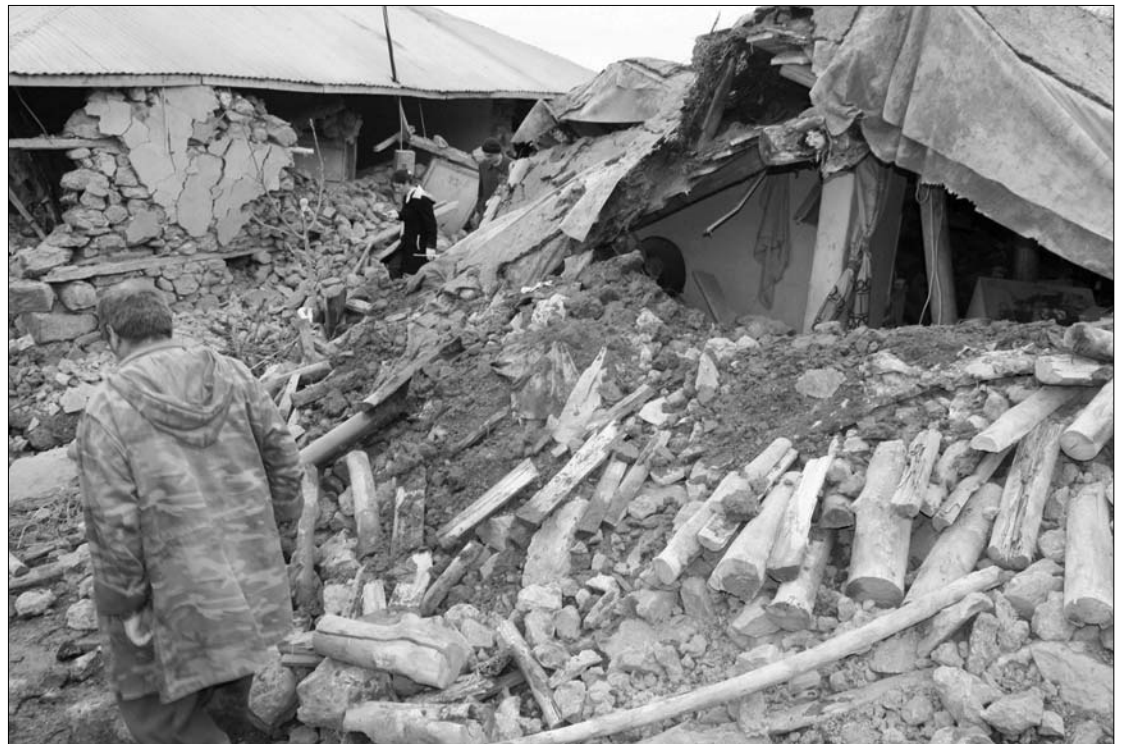
Törökországban gyakoriak a földrengések, az ország az észak-anatóliai törésvonal felett fekszik

nik során sebesültek meg, amikor az emberek az ablakokon és erkélyeken keresztül igyekeztek elhagyni otthonukat. Korábbi hírek szerint a természeti csapás Okular, Yukari Kanatli és Kayali falvakban követelt emberéleteket. Törökországban gyakoriak a földrengések, az ország nagy része ugyanis az észak-anatóliai törésvonal felett fekszik. ◀