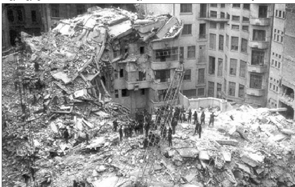
A román fővárosban 2636 épület sérült meg az 1977. március 4-i földrengésben

Mivel a földrengések időpontját gyakorlatilag nem lehet előre jelezni, csak kevésbé megnyugtató Mármureanu kijelentése, miszerint a következő tíz évben nem várható nagyobb erejű földrengés Romániában. Komolyabb földrengések az országban 1802-ben, 1838-ban, 1940-ben és 1970-ben voltak, így egy-egy erősebb földrengés között akár száz év is eltelhet – vélekedett, hozzátéve: mindez korántsem azt jelenti, hogy ne kellene haladéktalanul okulnunk Haiti és Chile példájából. Mivel az előző országban a hatóságok nem készültek fel kellőképpen a természeti katasztrófa hatásainak kivédésére vagy enyhítésére, a januári földrengés százerek életét követelte, míg a jóval felkészültebb Chilében a 64-szer erősebb rengés is csak néhány száz halottal járt. A felkészítés szempontjából Románia sajnos Haitihoz áll közelebb. ◀