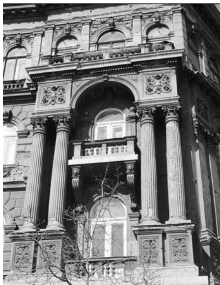
7. Budapest, Andrassy út 92–94., homlokzat-részlet