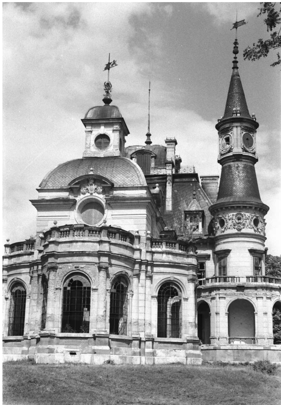
1. Tura, Schossberger-kastély. Bukovics Gyula, 1883