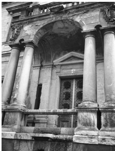
8. Tura, Schossberger-kastély, bejárati előépítmény a rövid oldalon