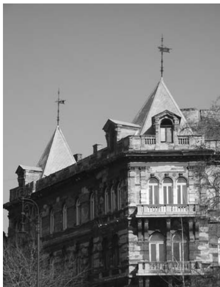
9. Budapest, Andrassy út 87–89., tetőzetrészlet