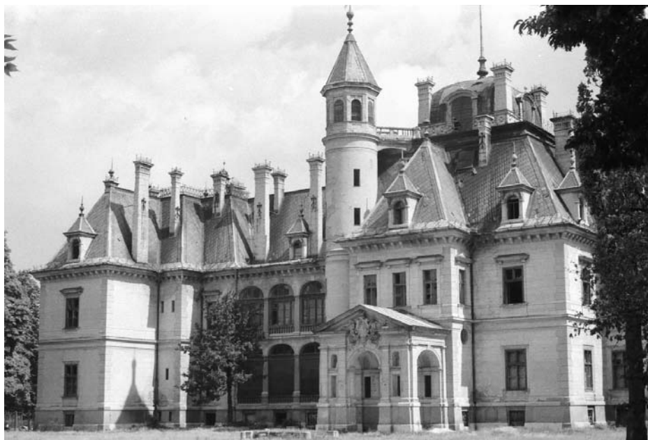
5. Tura, Schosberger-kastély, bejárat oldal