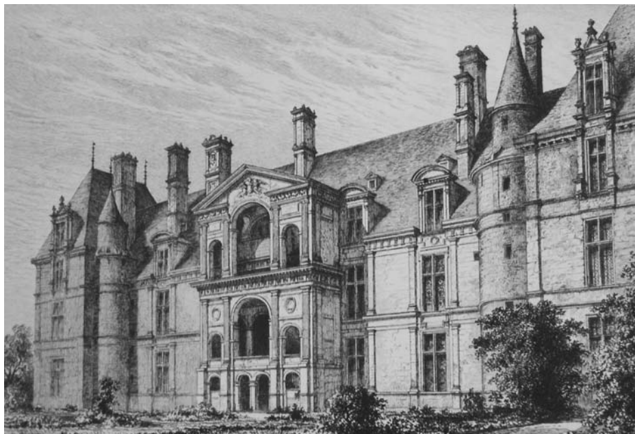
6. Ecouen, kastély, 16. század (Léon Palustré: La renaissance en France. Paris, 1881.)