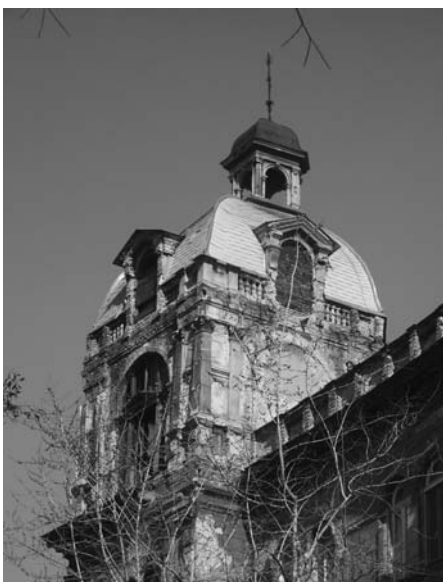
10. Budapest, Andrassy út 87–89., tetőpavilon