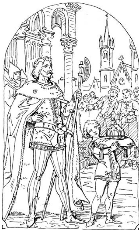
7. (Idősebb Storno Ferenc:) Szent László a Szent Koronát tartó herolddal. Vázlat. Jelzés, évszám nélkül. Papír, toll. SSMSGy, leltári szám nélkül.