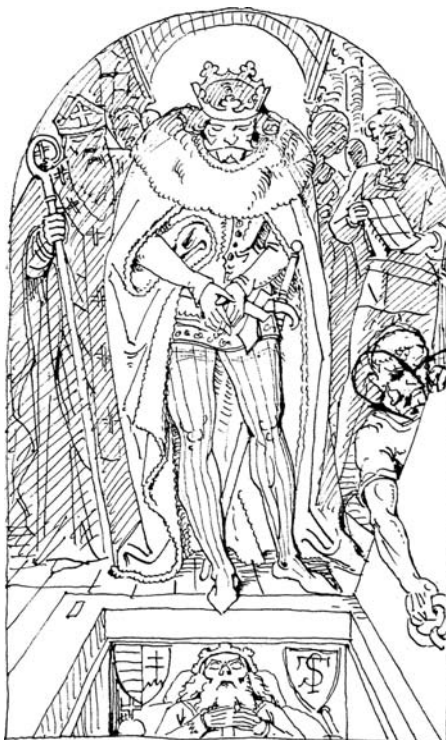
8. (Idősebb Storno Ferenc:) Szent László Szent István sírjánál. Vázlat. Jelzés, évszám nélkül. Papír, toll. SSMSGy, leltári szám nélkül.