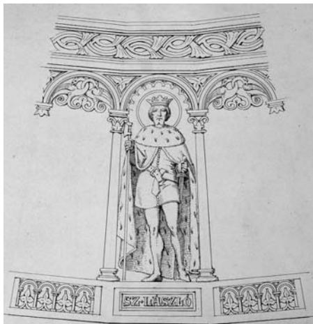
6. Idősebb Storno Ferenc: Részlet az alsúti (Fejér megye) kápolnába tervezett harangról Szent László alakjával. Papír, toll. SSMSGy, S. 84.3/145.