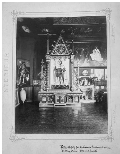
10. Stagl F.: A sárbogárdi római katolikus templom főoltára, 1894. Kartonra kasírozott albumin. SSMSGy, leltári szám nélkül.

zötlen feladatokra kívánja erőszakosan alkalmazni s így nem veszi figyelembe közművelődési viszonyaink azon középállomásait, sem átmeneti korszakunknak ama hézagait és nehézségeit, a melyekről épen a műveltebb érzésű és hazafiasabb lelkületű magyar művész, mint legbensőbb és szemérmesen titkolt bajainkról, csak ritkán és kelletlenül nyilatkozik.