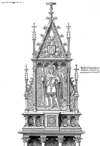
9. Ifjabb Storno Ferenc: A sárbogárdi (Féjér megye) római katolikus templom főoltárának terve. Papír, toll. SSMSGy, leltári szám nélkül.