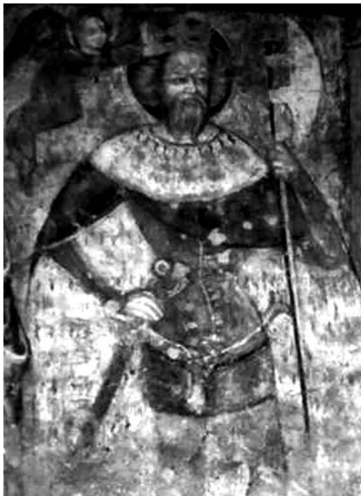
1. A veleméri (Vas megye) római katolikus templom Szent László-freskója. 1378.